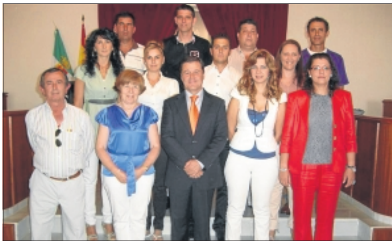
Nueva Corporación Municipal del Ayuntamiento de Aceuchal.

Seguidamente se ha procedido a la elección del alcalde de entre to-