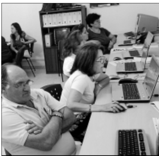
Grupo 4 de los talleres de alfabetización informática.

En cuanto al nivel de conocimientos, dos de los grupos han recibido talleres de iniciación, Alfabetización Tecnológica Básica (Escritorio, Procesadores de Texto, Navegador por Internet,