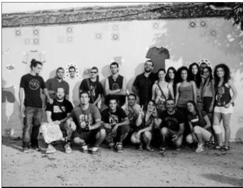
Artistas participantes en los Contenedores de Arte de Santa Marta.