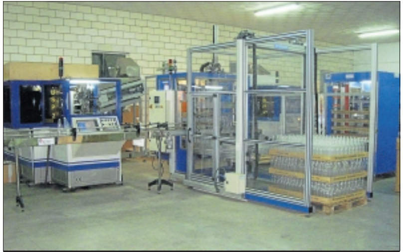
Termoplásticos Extremeños, empresa financiada por Fedesiba.

312. Ayudas a la creación y desarrollo de microempresas.