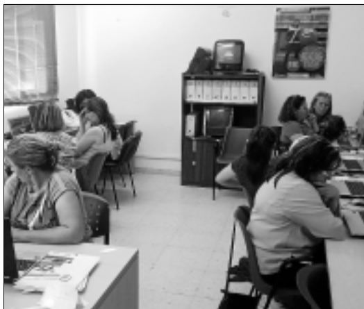
Grupo 2 de los talleres de alfabetización informática.