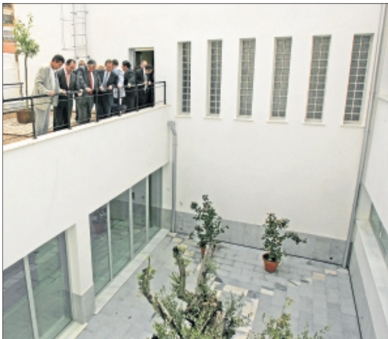
Patio interior del Centro Integral de Desarrollo de Villafraña.

ción para el desarrollo del mundo rural, y el centro inaugurado es precisamente un espacio para favorecer ese debate.