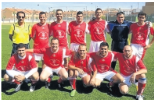
Equipo de fútbol de Aceuchal.

El deporte de Aceuchal vuelve a estar de enhorabuena. El pasado fin de semana, entre los días 11 y 12 de junio se disputó en la localidad de Badajoz el I Torneo Nacional de Fútbol 7 de Ayuntamientos, Fuerzas y Cuerpos de Seguridad, Bomberos y Fuerzas Armadas y el equipo de Aceuchal obtuvo un más que meritorio cuarto puesto. El equipo de Aceuchal estuvo formado por Guardia Civil y Policía Local de Aceuchal. Cayeron derrotados en semifinales con quien a la postre sería proclamado campeón, el equipo del Cuartel General Menacho de Ingeniería, quedando en segundo lugar el equipo también del Cuartel General Menacho Castilla 16, que había derrotado en la otra semifinal al equi-