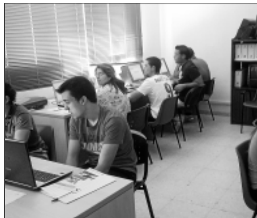
Grupo 3 de los talleres de alfabetización tecnológica.