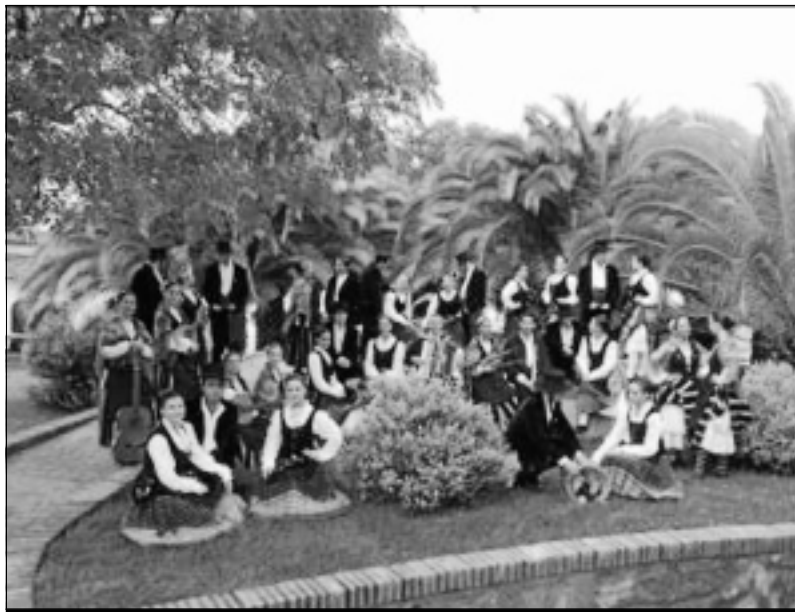
Miembros de la Asociación cultural y folclórica Tierra de Barros.

Estas declaraciones las hizo este fin de semana ante las cientos de personas que llenaban el teatro Carolina Coronado en el acto de clausura de las academias de bailes de la asociación Tierra de Barros.