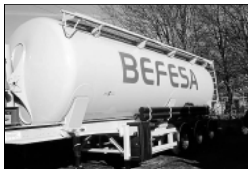
Uno de los camiones de Befesa.

mente las características de las distintas muñecas. La exposición ha gozado de una inesperada y gran aceptación por parte del público.