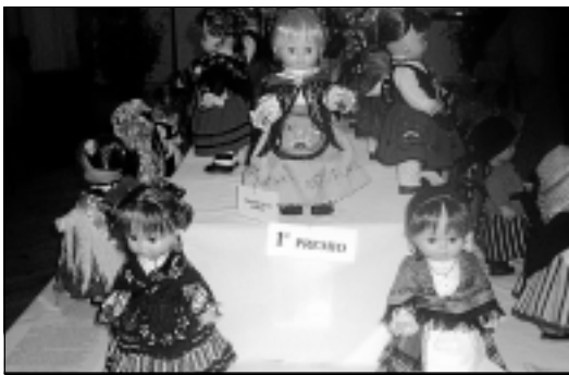
Pódium de muñecas vencedoras, presidido por Montina.

sición ha estado expuesta en Villalba, en el local de la asociación de Mujeres Rurales Aldonza, donde su presidenta hizo de guía dando a conocer más detallada-