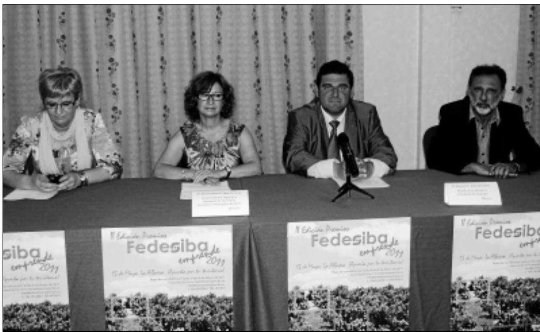
La diputada de Desarrollo Rural, la consejera de Economía, el presidente de Fedesiba y el de Redex.

El objetivo de FEDESIBA con la entrega de estos premios es fomentar el espíritu emprendedor de la comarca y rendir el merecido reconocimiento a aquellos empresarios que creen en las posibilidades de desarrollo del medio rural.