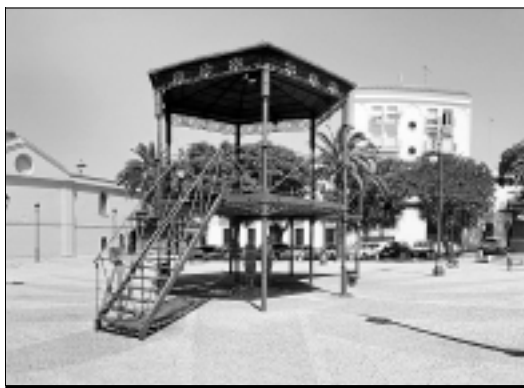
Vistas de Villafranca de los Barros.