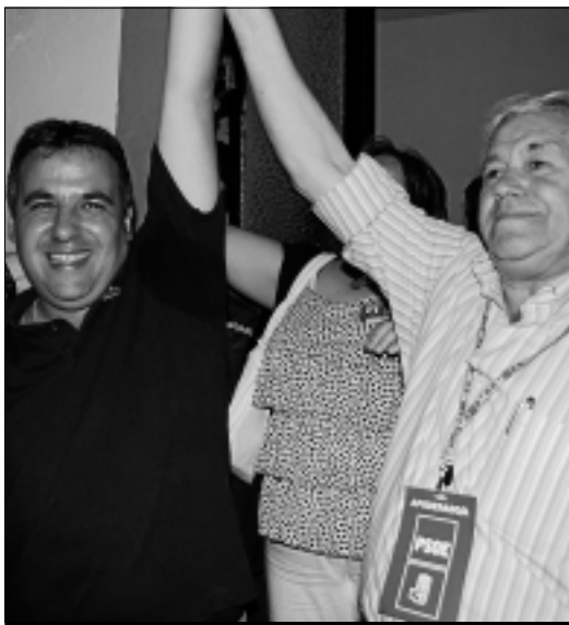
Celebración de los socialistas por la victoria de las elecciones