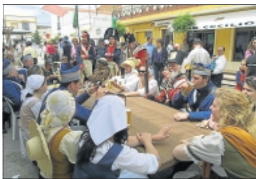
Vecinos de La Albuera en una estampa de la época.