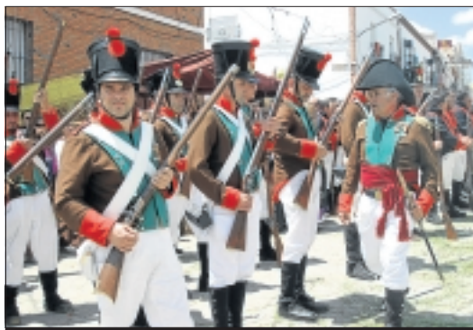
Ejércitos representando momentos de la histórica batalla.