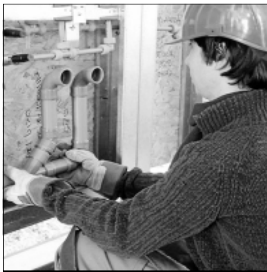
Uno de los alumnos del taller.

A continuación, se ha procedido a la entrega de diplomas a los alumnos de las dos especialidades del Taller de Empleo Matachel II. Según publica villafrancadelosbarros.blogspot.com, durante un año se han formado en las especialidades de electricidad de