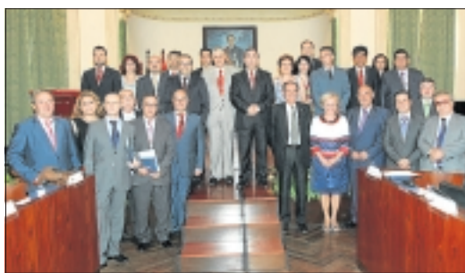
Foto de familia de la corporación provincial de Badajoz.