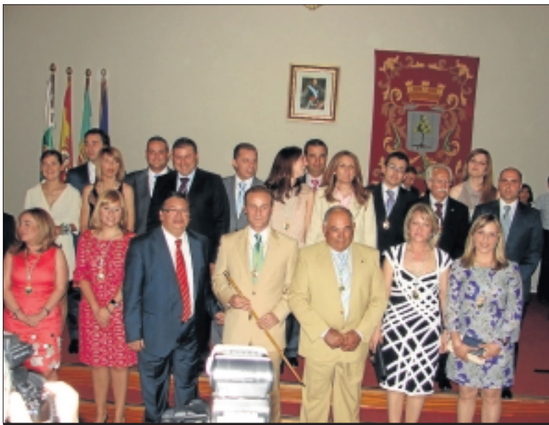
La nueva corporación municipal de Almendralejo.