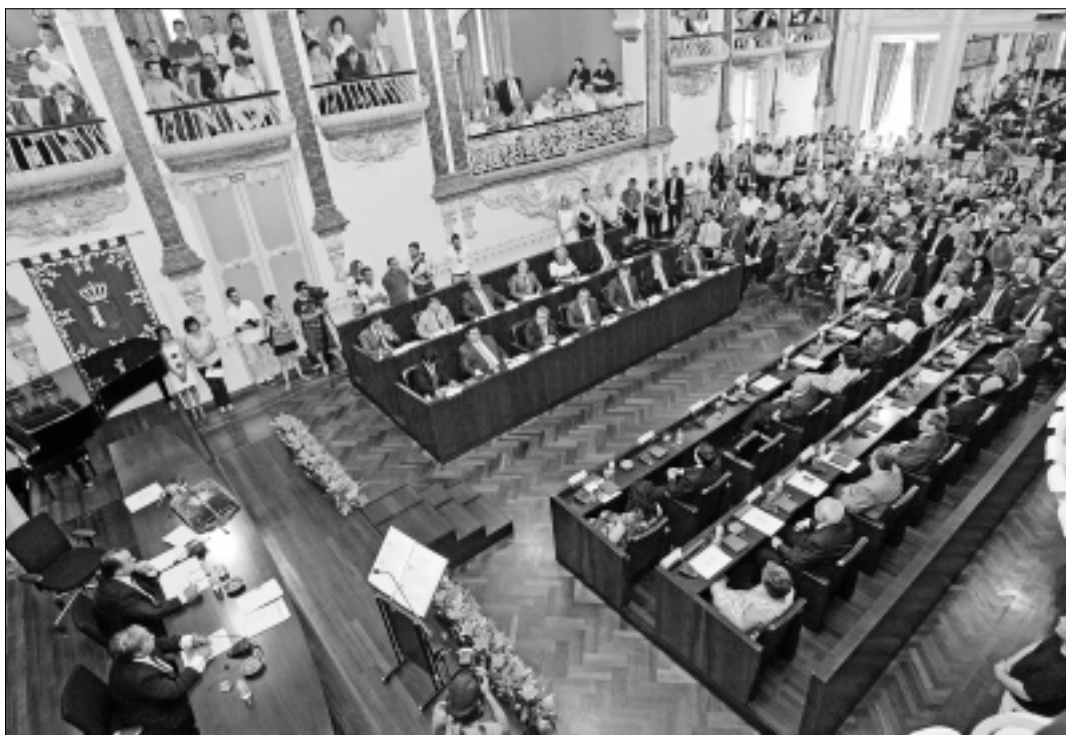
Vista general del salón de plenos de la Diputación de Badajoz durante el acto institucional.

Afirmó que no puede entenderse actualmente la diputación como algo distinto a los municipios y definió a la institución como “los municipios trabajando conjunta y solidariamente”. En cuanto al papel de la entidad, Cortés