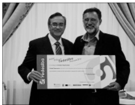
El presidente de Adesam, accésit a Entidad, y el de Redex.