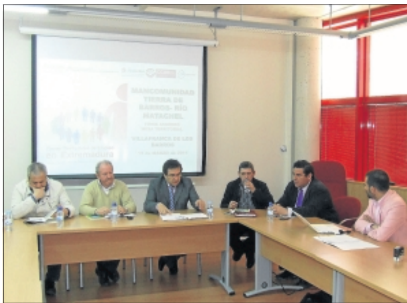
Representantes de la Mancomunidad Tierra de Barros-Río Matachel y FEDESIBA.

nal de los recursos humanos, la dinamización de la actividad económica y el fortalecimiento del tejido productivo mediante la programación, seguimiento y evaluación de todos los firmantes. Los Planes Territoriales de Empleo pretenden programar y desarrollar en el ámbito territorial de las respectivas Mancomunidades Integrales que conforman la comarca, un conjunto de medidas activas de empleo complementarias entre sí, planificadas, pactadas y seguidas por una mesa territorial de empleo mediante la realización de diversas acciones que mejoren estructuralmen-