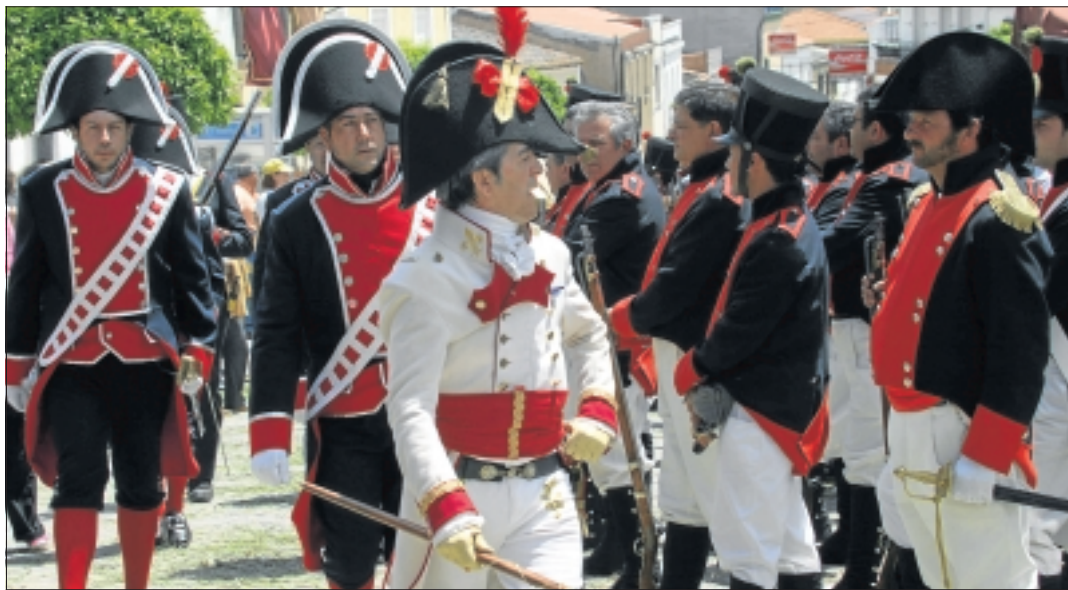
Desfile de las tropas en la conmemoración.

Hasta ahora, la representación dramatizada de aquella masacre en el contexto de la Guerra de la Independencia, que costó 15.000 vidas de entre 80.000 combatientes, se ha presentado desde la visión del pueblo y del ejército en sendas obras. Pero este año, en el que se conmemora el bicentenario de la batalla, se estrena la ter-