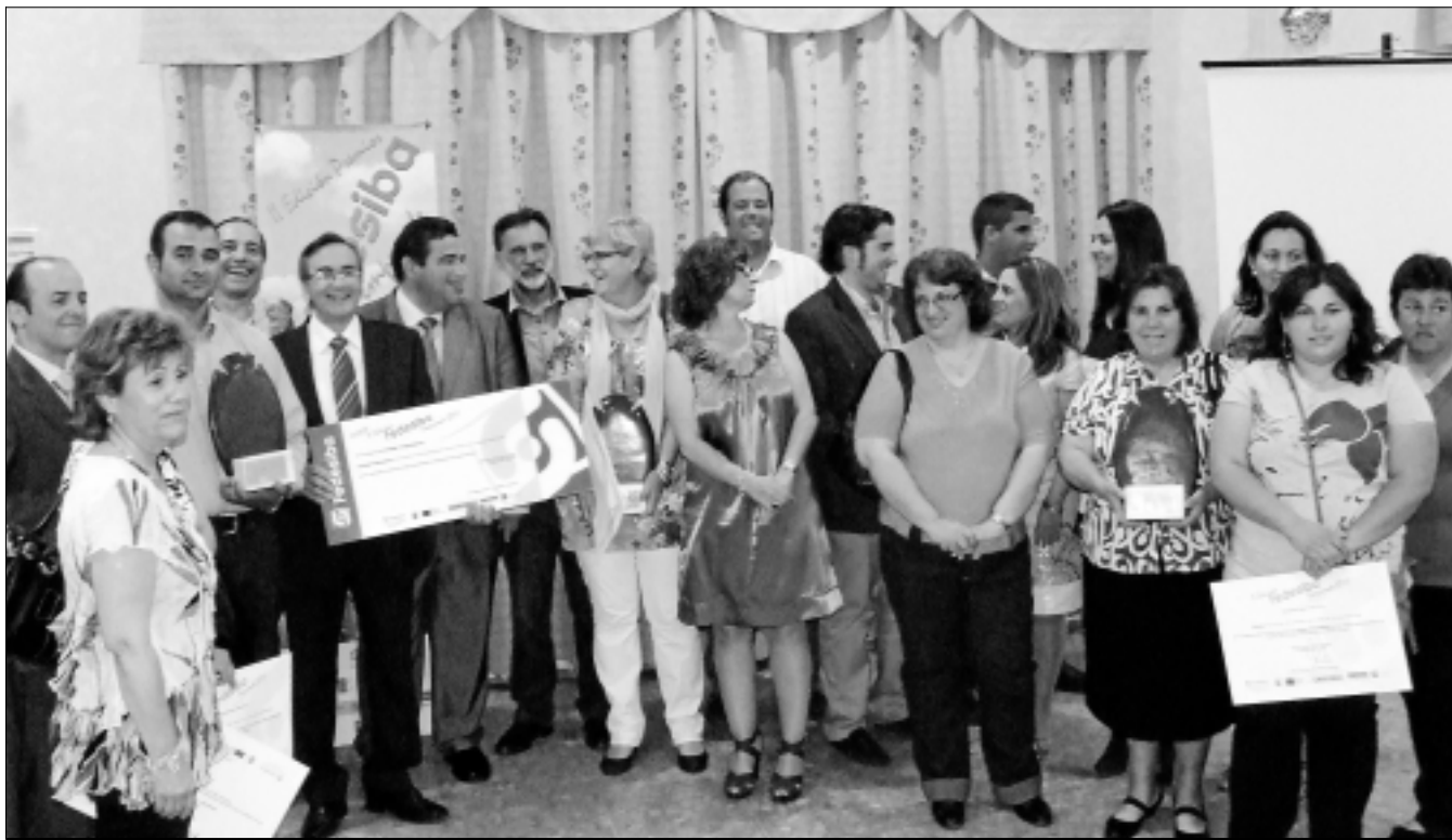
Galardonados con los premios FEDESIBA Emprende.