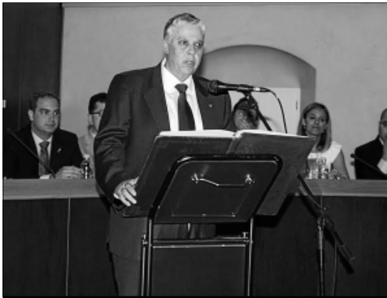
El alcalde de Villafranca, Ramón Ropero, en la toma de posesión.

Tras una jornada electoral tranquila y sin incidentes y con una participación del 79,9%, unos tres puntos y medio inferior a la de 2007, el PSOE-Regionalistas volvía a conseguir la mayoría absoluta en el Ayuntamiento de Villafranca, aunque pierde dos concejales. Ramón Ropero volverá a llevar las riendas del gobierno villafranqués cuatro años más. PP y la Agrupación de Electores ganan un concejal más cada uno, por lo que la Corporación Municipal queda constituida con 9 concejales del PSOE, 4 del PP y 4 de Ciudadanos de Villafranca. Con un censo de 10.354 votantes, han ejercido su derecho al voto en la localidad 8.283 personas. El Partido Socialista ha conseguido 4.170 votos, 813 votos menos que en 2007; el PP obtenía 2.116 votos, 493 más que en las pasadas elecciones municipales, y por último, la Agrupación de Electores Ciudadanos de Villafranca conseguía 1.703 votos, 82 menos que en 2007. Con lo que, y en porcentajes, el 50,34% de los votos son para el PSOE, el 25,54% para el PP y un 20,56% para Ciu-