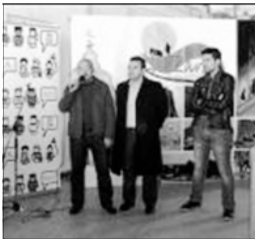
Acto de inauguración del centro.

Este centro se incorporará a la red de Espacios para la Convivencia y Ciudadanía Joven de la región, que está compuesta en la actualidad por 31 centros de estas características que recibieron en 2010 más de 30.000 visitas.