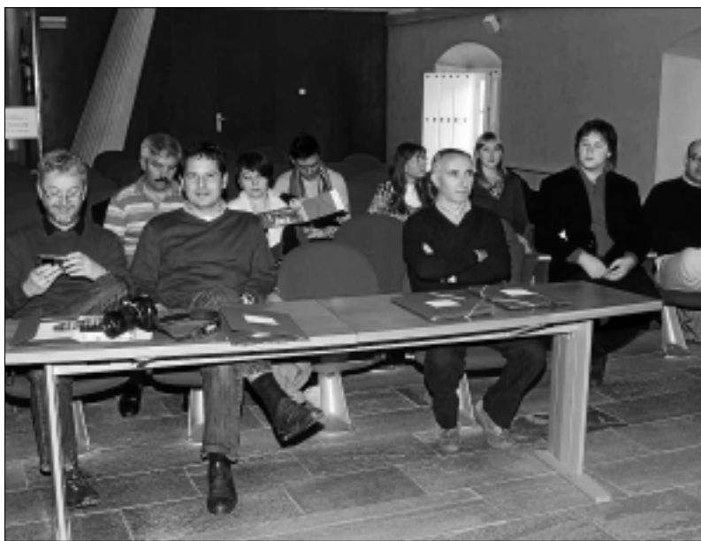
Juventud de Villafranca durante uno de los encuentros.

A final de mayo en la localidad portuguesa de Vilafranca de Xira, se celebró la primera reunión del Programa de Juventud en Acción