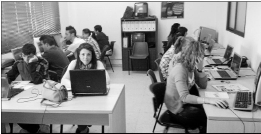
Grupo 1 de los talleres de alfabetización informática.

Además, el Ayuntamiento de Corte de Peleas ha costado los