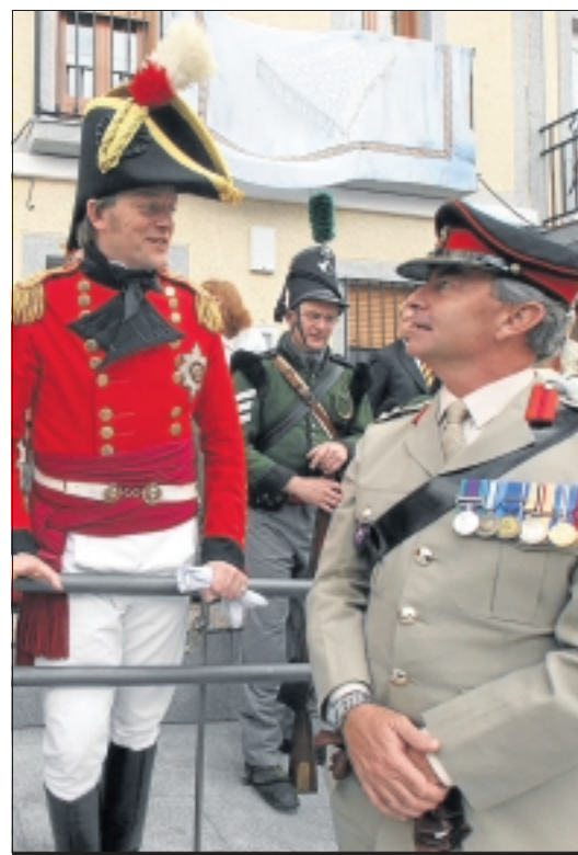
Conmemoración de la Batalla de La Albuera, acto militar.