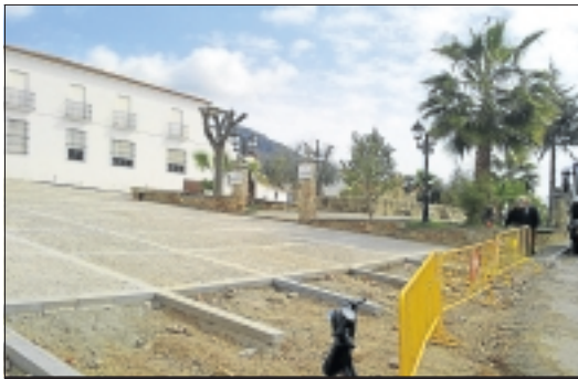
Obras en la Plaza del Pilar de Hornachos

Por otra parte, han comenzado también las obras de acondicionamiento de varios viales con un presupuesto superior a los 40.000 euros financiados por Ayuntamiento de Hornachos. En concre-