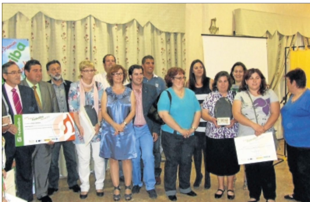
Foto de los galardonados con las autoridades en la entrega de premios.

COFINANCIA FONDO FEADER MEDIDA 323 PDR EXTREMADURA 2007-2013