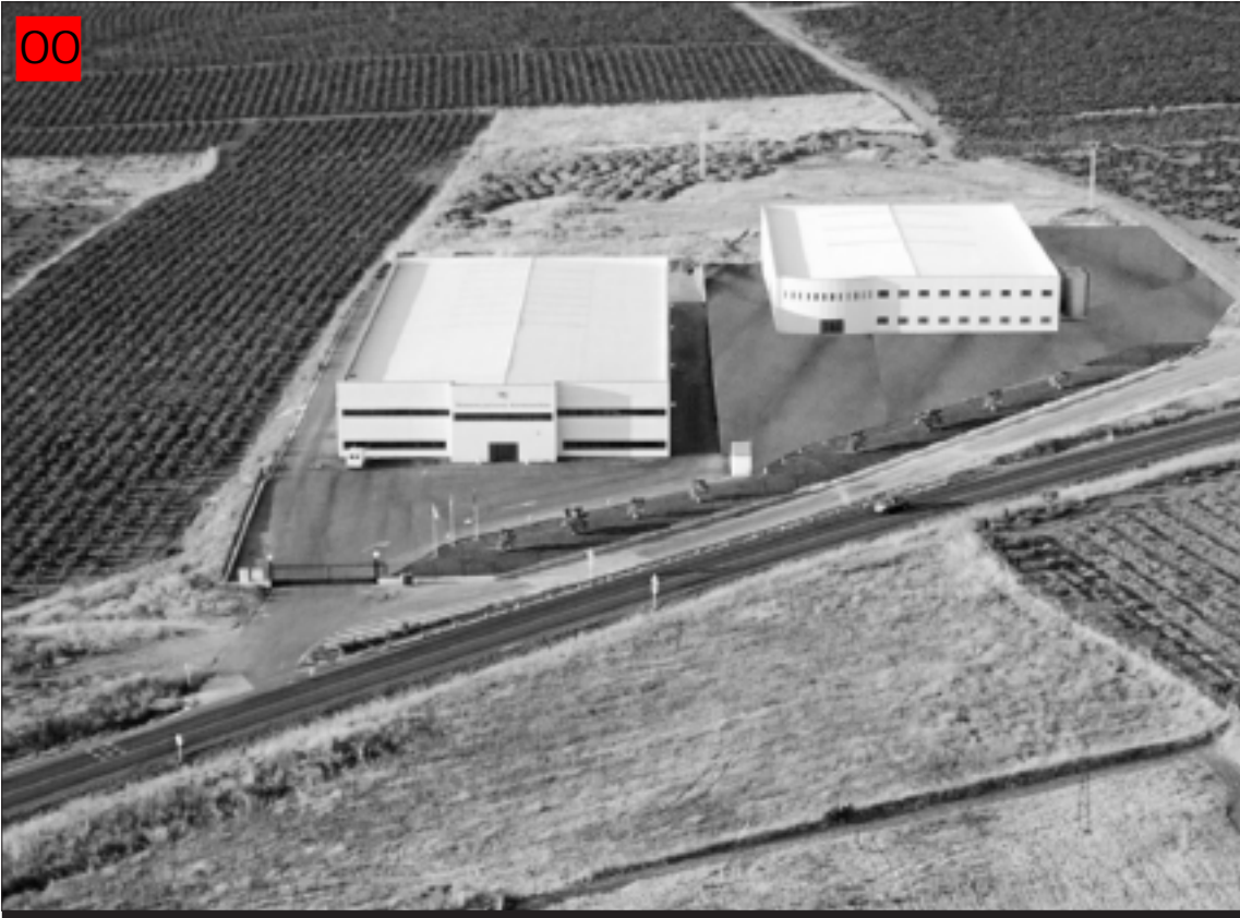
Planta de Termoplásticos Extremeños en Aceuchal.

–¿Cómo ha evolucionado su negocio? ¿Le ha afectado la situación económica actual?