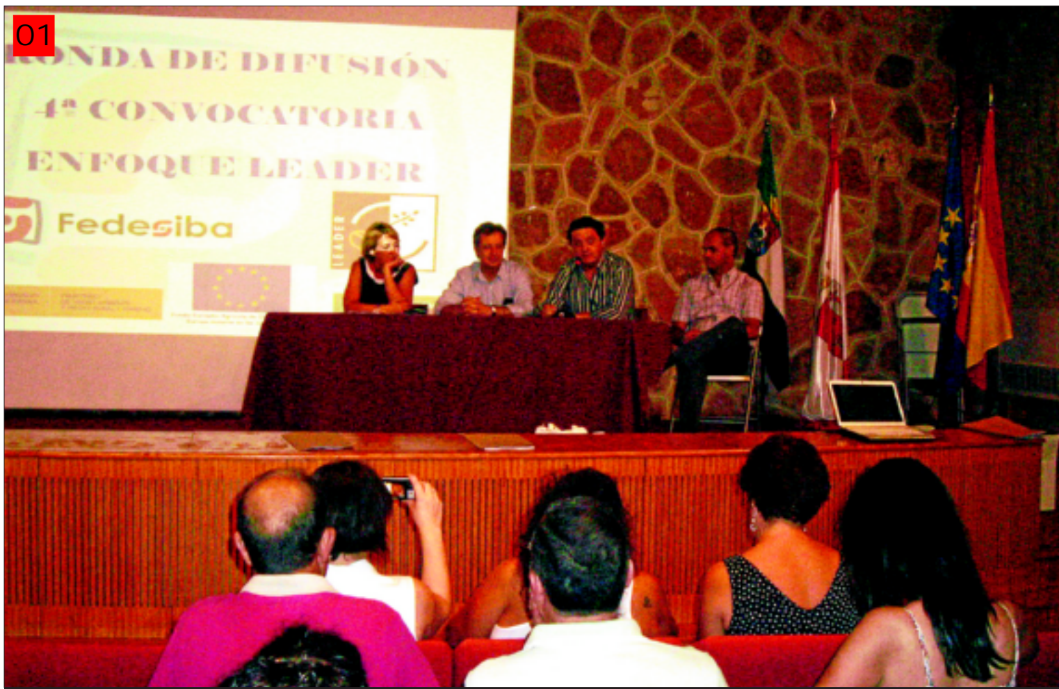
P Una de las jornadas informativas sobre la cuarta convocatoria de Enfoque Leader en Villafranca de los Barros.

COFINANCIA FONDO FEADER MEDIDA 323 POR EXTREMADURA 2007-2013