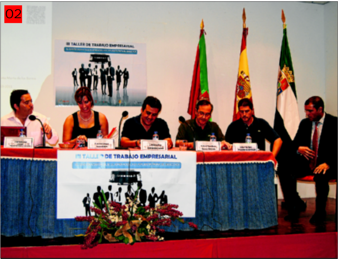
Intervinientes en el III Taller Empresarial.

Además de poner en común las necesidades y recursos con los que cuentan las empresas locales y de profundizar en el conocimiento de las herramientas que posibilitan la innovación, fenómeno al que definieron como “cambiar mejorando y obteniendo un beneficio económico”, también se habló sobre la pertinencia de celebrar jornadas como esta, en la que se potencia la dinamización del tejido empresarial.