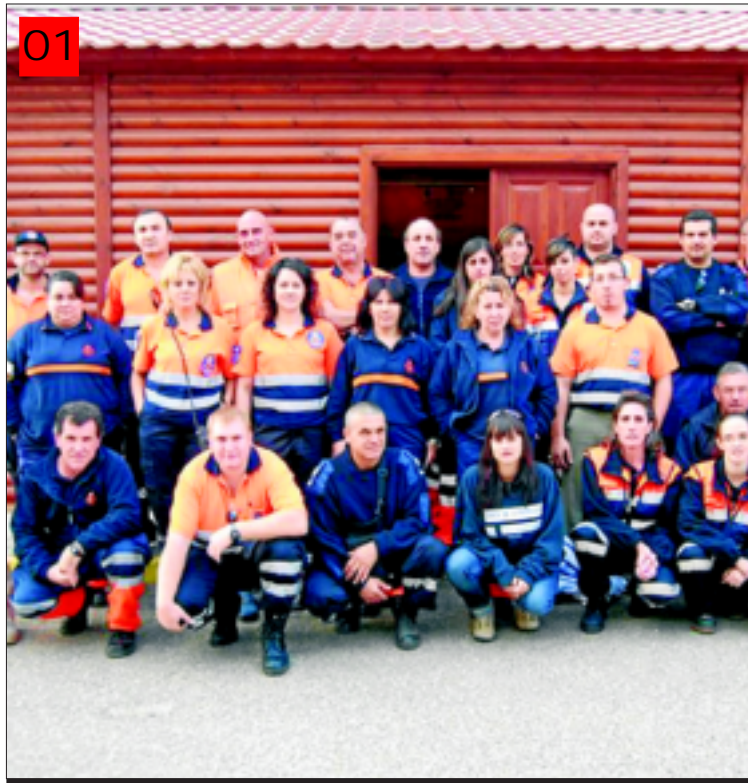
Participantes en las Jornadas de Voluntarios