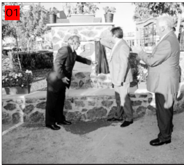
El doctor Barbacid descubre la placa con su nombre del parque.

Además de haber dirigido el Centro Nacional de Investigaciones Oncológicas, también ha estado al frente de otras prestigiosas instituciones como el departamento de Oncología del Instituto Squibb de Princeton, en Estados Unidos y ha contribuido a crear la Red Española de Bancos de Tumores.