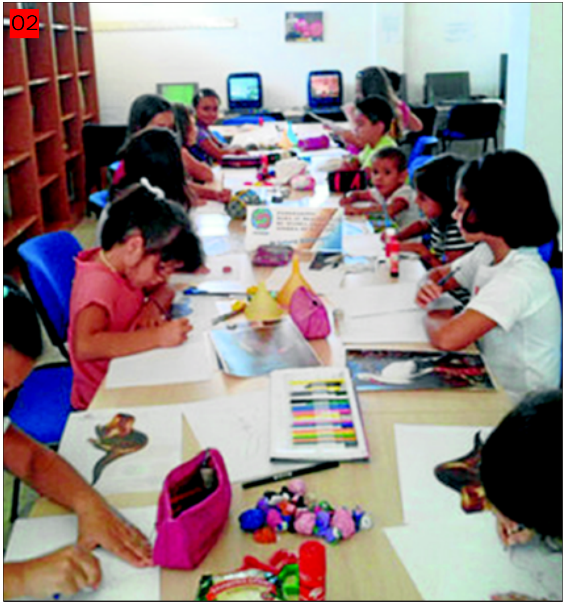
Los niños durante el desarrollo del concurso de dibujo.

conservación. La técnica era totalmente libre, pudiendo emplear cualquier tipo de material: acuarelas, lápices, ceras, témperas, etcétera. La jornada permitió a los participantes disfrutar de una jornada amena a la vez que conocían su espacio natural y las especies protegidas que acoge. A la finalización de la misma se les hizo entrega de regalos por su participación.