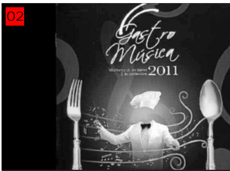
Procesión de la Virgen Coronada en la Fiesta de la Vendimia.