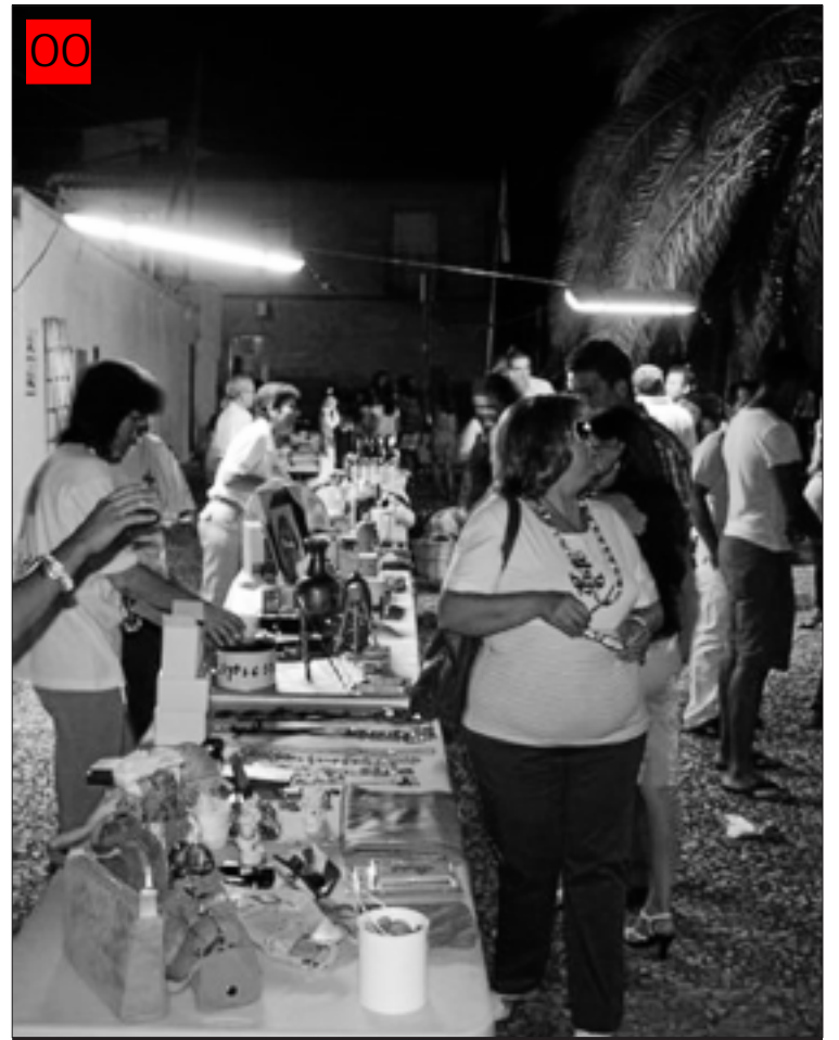
Mercadillo Solidario de Cruz Roja de Hornachos.

Por otra parte, éste ha sido el tercer año que la Plaza de San Francisco acoge el Festival Moriscorock; esta edición ha contado con las actuaciones de Síncope, Banu Maimun y The Fatty Farmers.