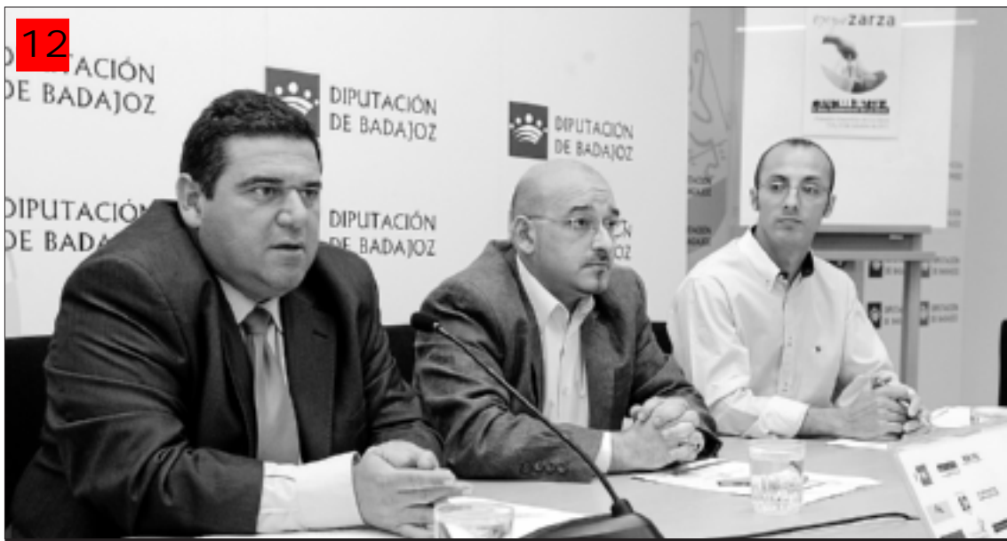
Presentación de ExpoZarza 2011 en la Diputación de Badajoz

La inscripción en la ruta motera fue gratuita.