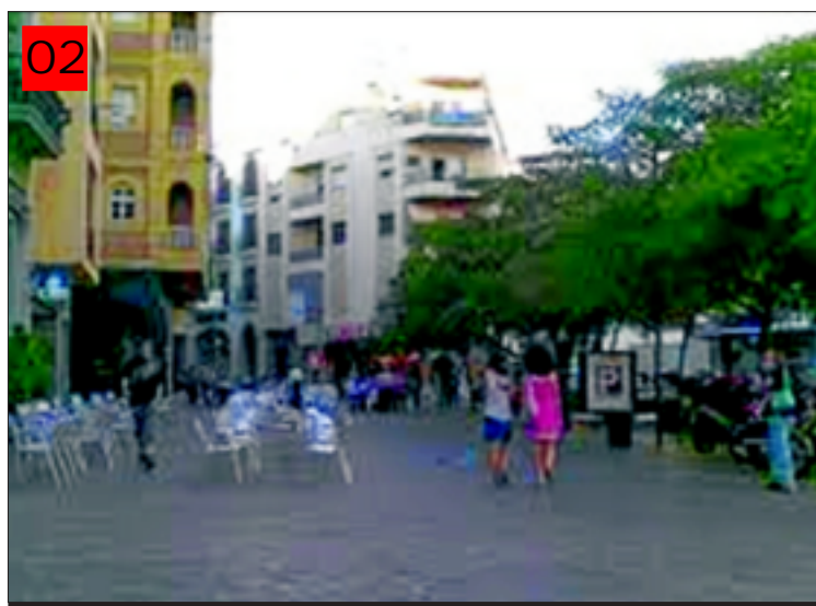
Terrazas de Almendralejo.