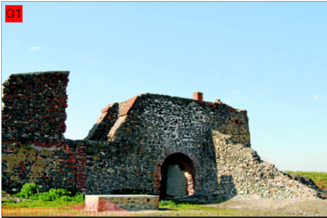
Castillete de la Mina Constante, donde se encuentra el Poblado Minero de Santa Marta.