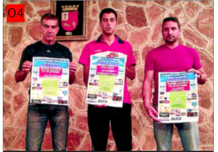
Representantes de la Escuela

contando también con préstamo de instrumentos. Podrás formar parte del proyecto de creación de la Banda Municipal de Música de Aceuchal.