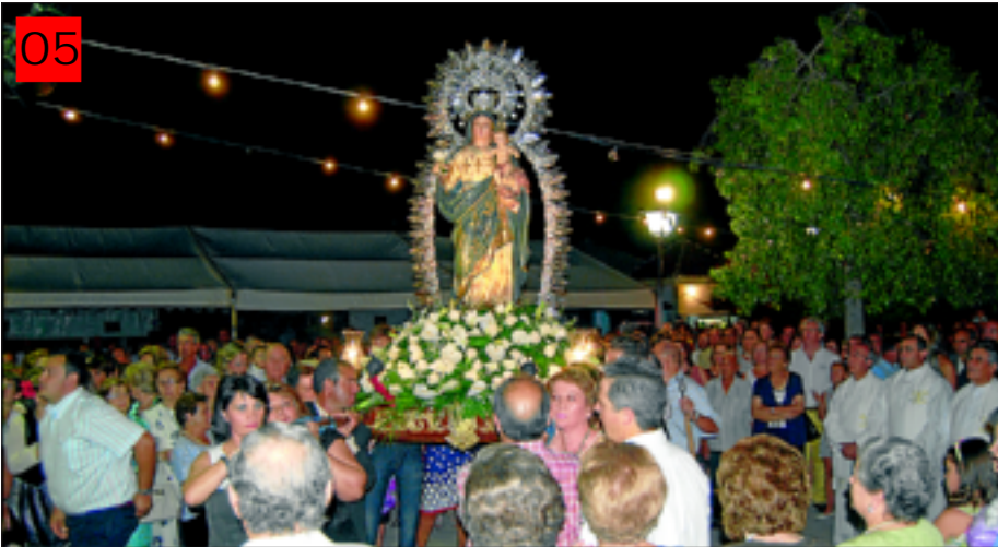
05 Emoción en la recogida de la Virgen Llegada de la Virgen de Gracia al atrio de su ermita, tras la procesión, que fue recogida por la directiva entre vítores y cantos.