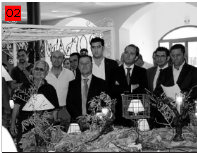
Autoridades recorriendo los diferentes expositores.