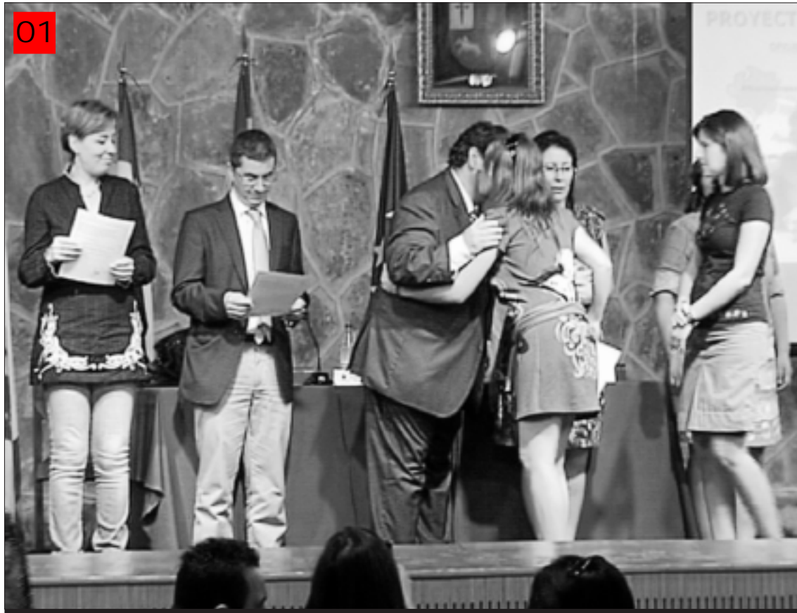
Entrega de diplomas a las alumnas por parte de las autoridades.