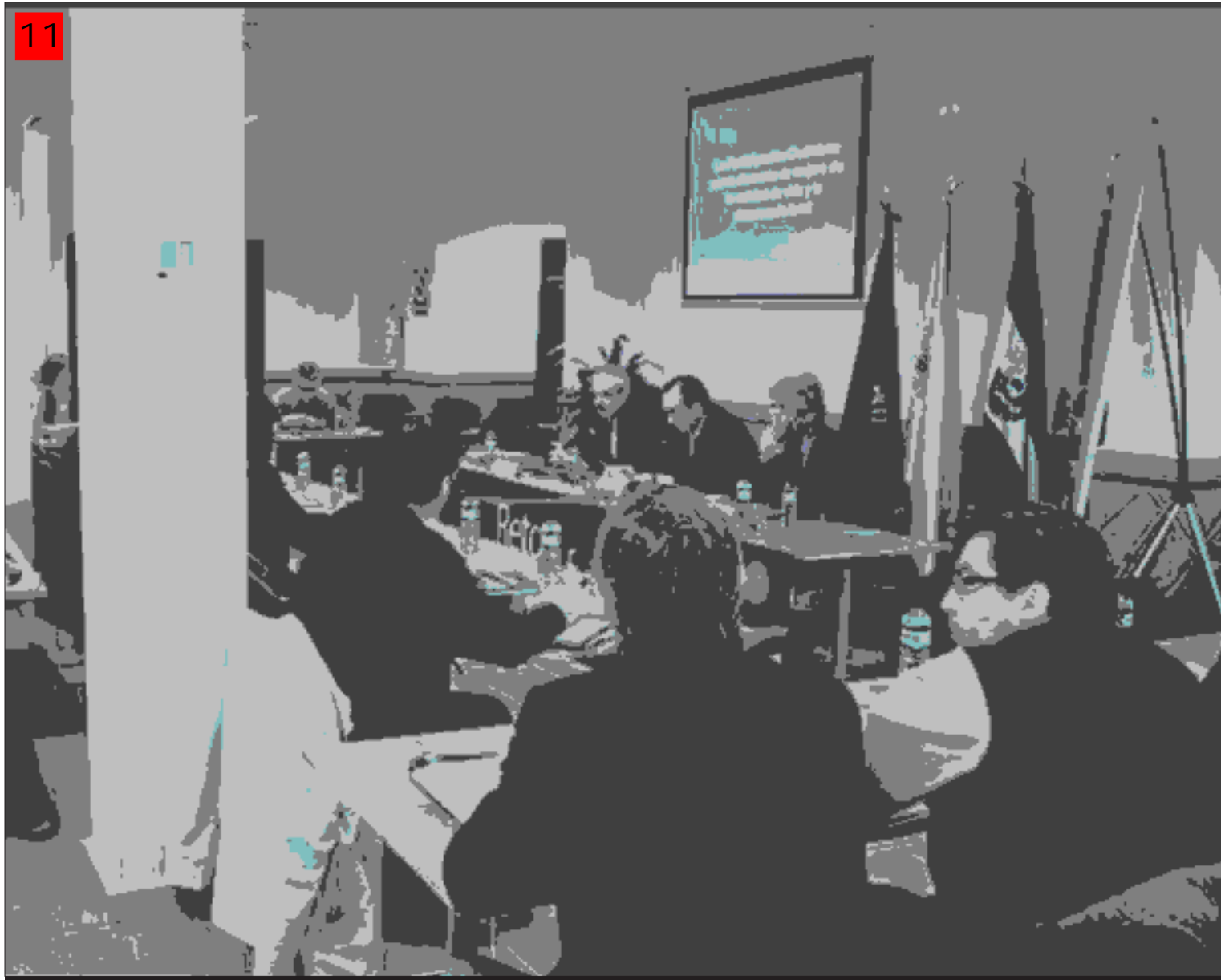
Celebración del IV Foro Local de la Diputación de Badajoz en Llerena.