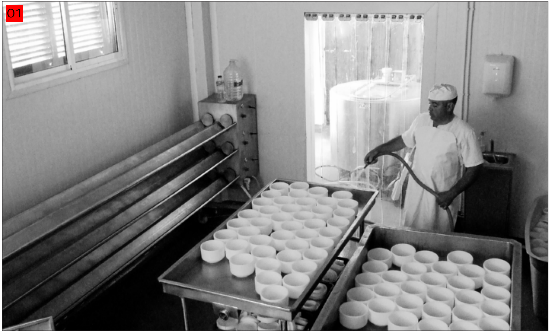
Quesería Artesana Santiago Madera, uno de los promotores de FEDESIBA