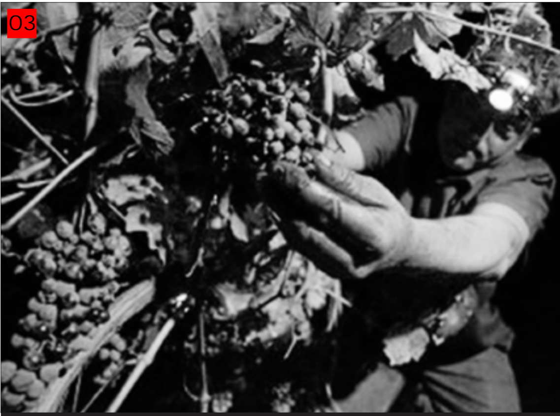
'Dedicación al detalle' para extraer lo mejor de Tierra de Barros.

–¿Le ha afectado la situación económica actual? –Parcialmente, seguimos aumentando clientes y ventas. Asimismo, lo más importante es que nuestros productos, tanto vi-