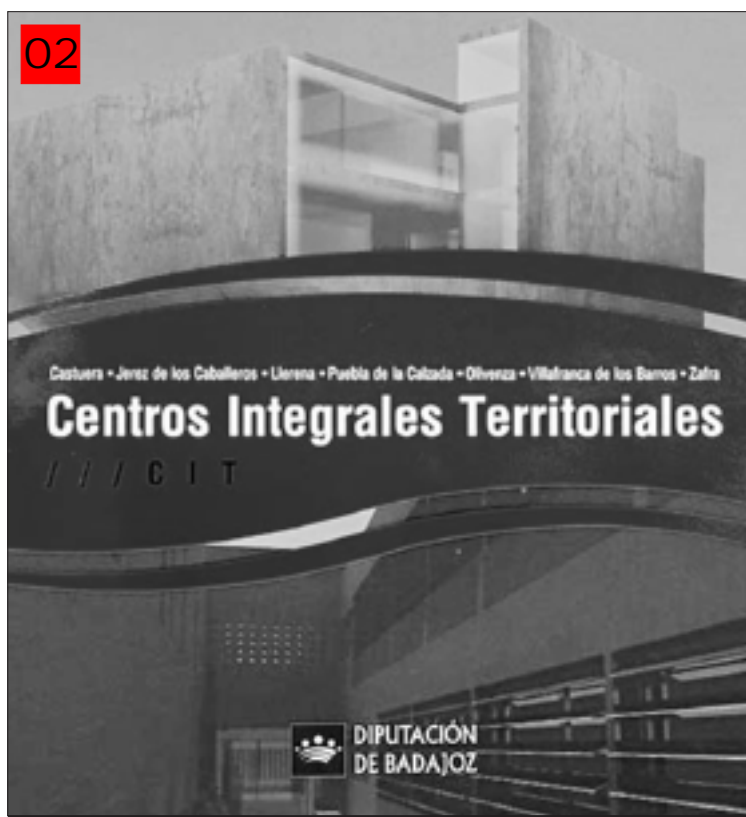
El proyecto Centros Integrales Territoriales, uno de los éxitos del ROT.

vos más desfavorecidos o con mayores dificultades de inserción o reinserción laboral de la provincia de Badajoz. PROEISOL facilitará cualificación profesional a trabajadores desempleados para poder acceder a las ofertas que vienen realizando las empresas del sector de servicios en el ámbito asistencial y dará continuidad a los trabajos que ya están concluyendo del proyecto DELOSS, perteneciente a la anterior convocatoria.