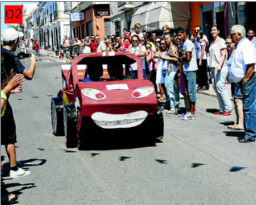
02 Concurso de Autos Locos en la feria de Santa Marta

La Asociación Cultural y Folclórica Tierra de Barros no falta nunca a su cita con la Virgen de la Piedad, patrona de Almendralejo, y con la fiesta de la Vendimia. Los miembros del grupo folclórico participan de manera activa en el acto central de las fiestas. En esta imagen se ve a miembros de la agrupación haciendo su entrada en el atrio de la ermita de la Piedad.