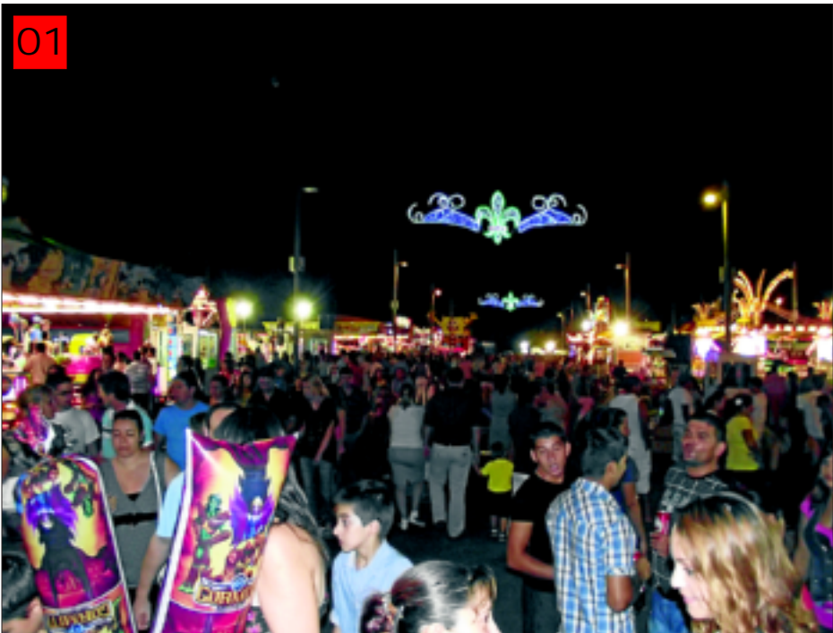
01 El recinto feria de Almendralejo, abarrotada de público todos los días de la feria de la Piedad

EN ESTA DOBLE PÁGINA SE HACE UN REPASO DE LAS MÁS IMPORTANTES ACTIVIDADES LÚDICAS SU- CEDIDAS EN LA COMARCA EN LOS ÚLTIMOS MESES