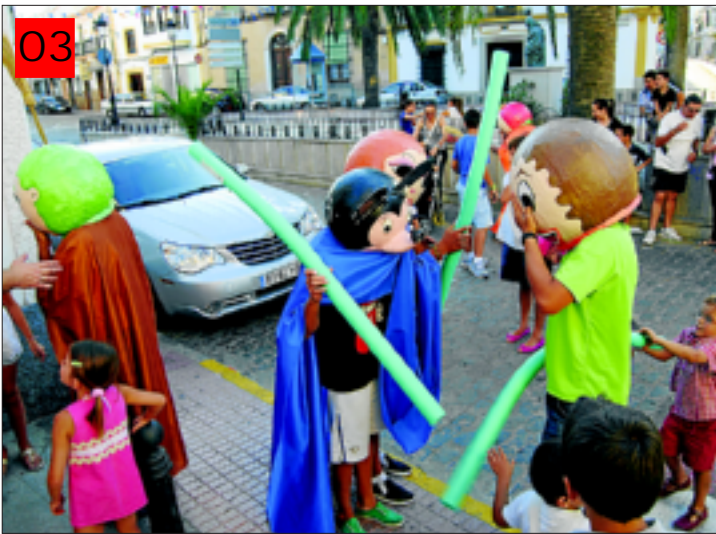
03 Desfile de cabezudos en Santa Marta Otra de las nuevas actividades de la Feria de Santa Marta fue el desfile de cabezudos, una tradición que se ha recuperado.

Santa Marta tuvo sus fiestas en julio y en septiembre. En la imagen, una novedad incluida en el programa de este año: el concurso de Autos Locos. El punto de salida se situó en la Ermita de la Virgen de Gracia y la meta en la plaza de las Palmeras. Esta es la primera vez que se celebra este concurso en Santa Marta. El coche ganador fue Rayo Mac Queen.