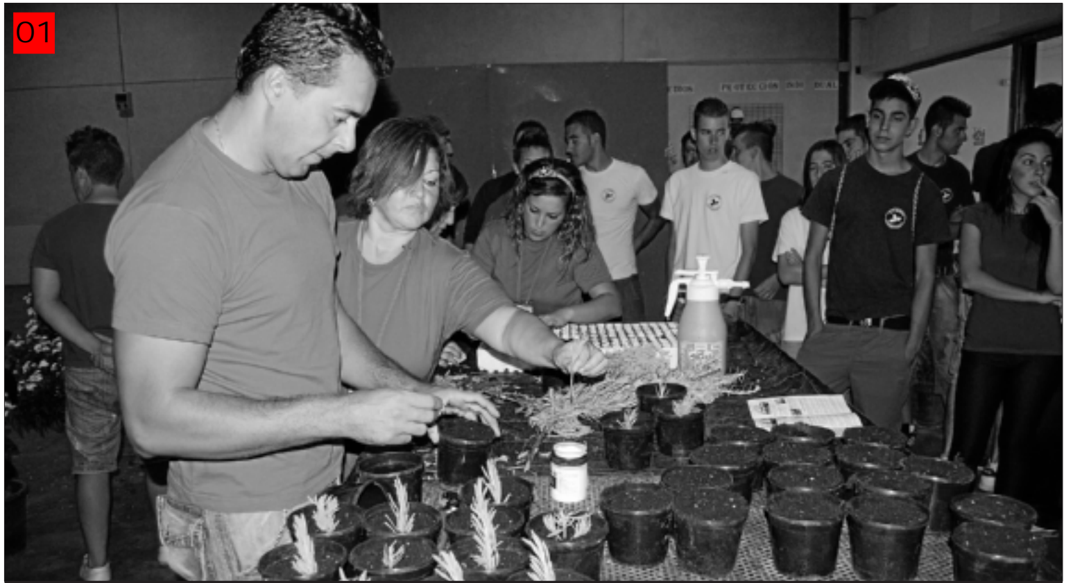
Alumnos del módulo de viverismo del Taller de Empleo.

La jornada del taller de Santa Marta constó de diferentes actividades. La primera de ellas fue una demostración práctica de los alumnos de jardinería, en la que llevaron a cabo la plantación por esquejes, una de las técnicas que