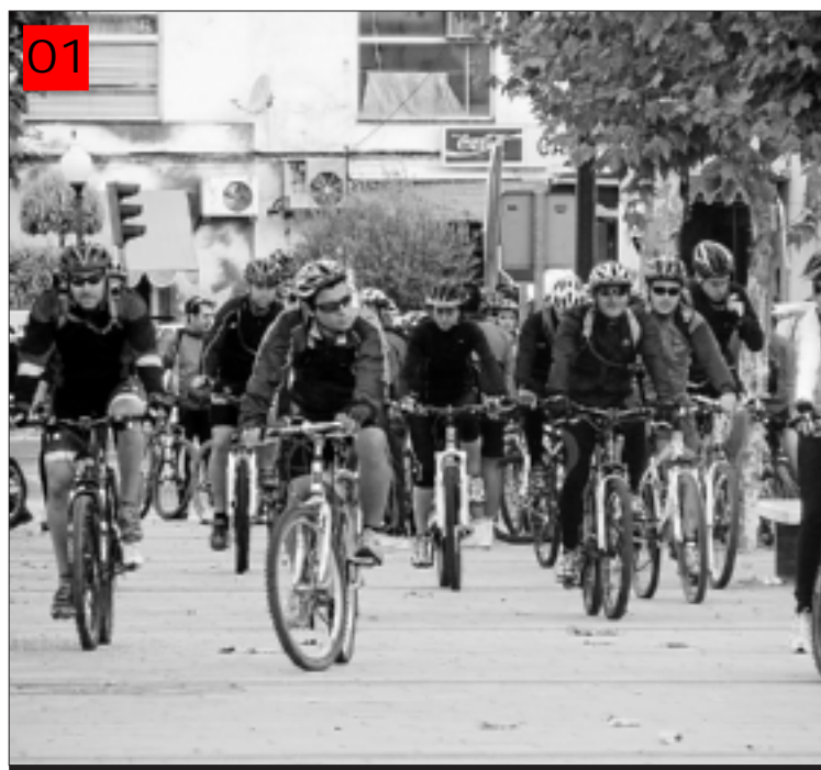
Participantes en la primera Quedada La Cañada.

Como nota informativa comentar que el club con sólo 2 meses de vida, ya cuenta con casi 30 socios, y durante el fin de semana, el blog oficial del mismo ( http://clubciclistalacanada.blogspot.com/ ) ha recibido más de 300 entradas. Desde la entidad se seguirán organizando actividades, como el concurso "Crea Tú el Logo", actividad para elegir el logo oficial de la entidad, con la que se pretende conseguir la participación de todos los sectores de la población.