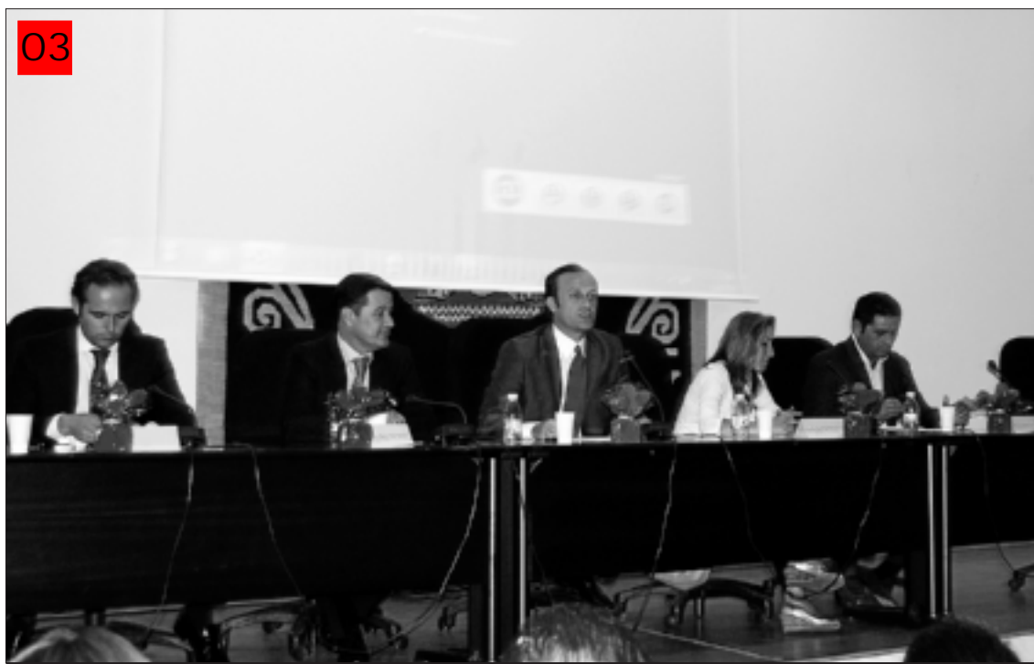
Mesa de autoridades durante la inauguración