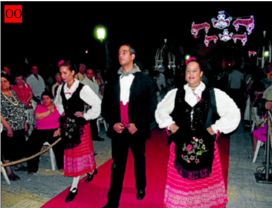
00 El folclore regional del grupo Tierra de Barros, imprescindible en la feria de la Piedad de Almendralejo

Miles de personas pasaron por el recinto ferial de Almendralejo durante los días que se celebraron la Feria de la Piedad y Fiestas de la Vendimia. Casetas con música, atracciones para todas las edades y mucho ambiente ofreció un recinto abarrotado de gente con ganas de pasarlo bien, y no sólo de almendralejenses ya al ferial acuden personas de todos los pueblos de la comarca.