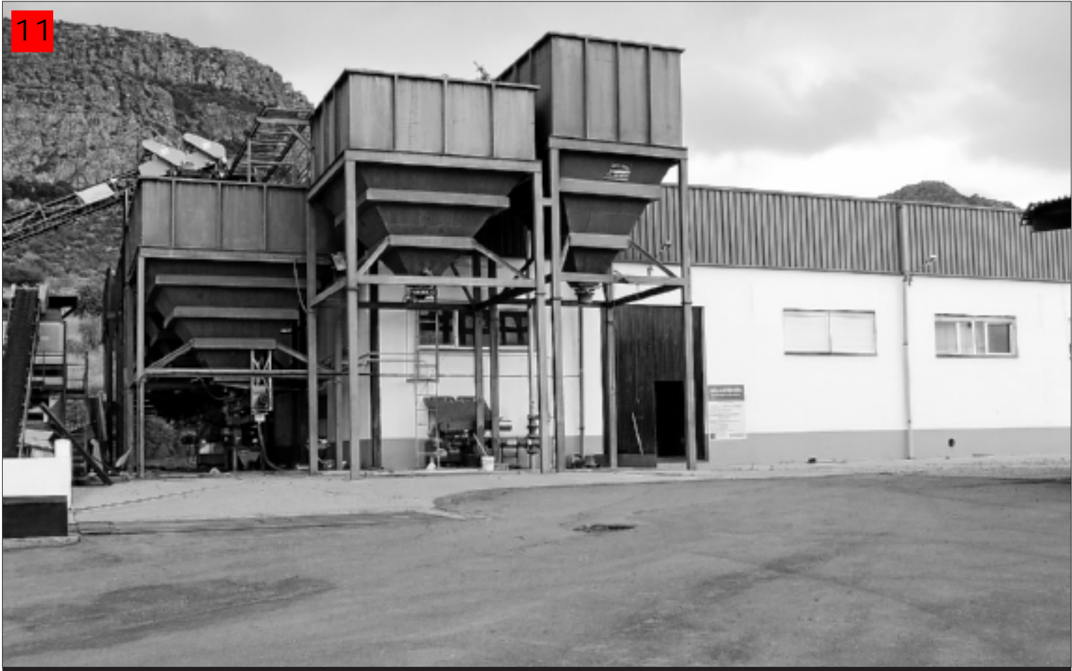
Otra empresa promotora de FEDESIBA de Hornachos.

Estos resultados conseguidos nos hablan de la capacidad de reinención que nuestro tejido empresarial y social tiene de cara a afrontar los nuevos escenarios de futuro.