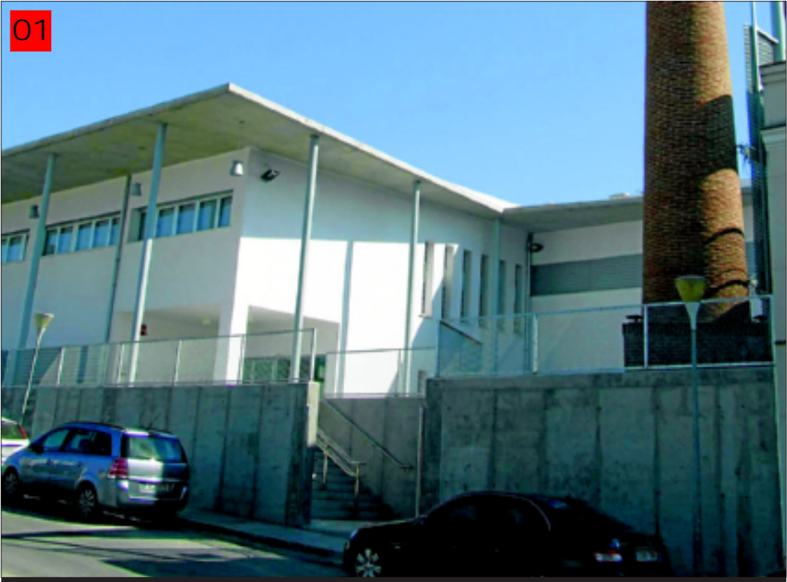
Exteriores del CIT de Villafranca.

El proyecto ‘Red de Observatorios Territoriales’ está desarrollando una estrategia de trabajo para la creación de una Red de centros integrales para el desarrollo local ubicados en diferentes territorios mancomunados de la provincia de Badajoz.