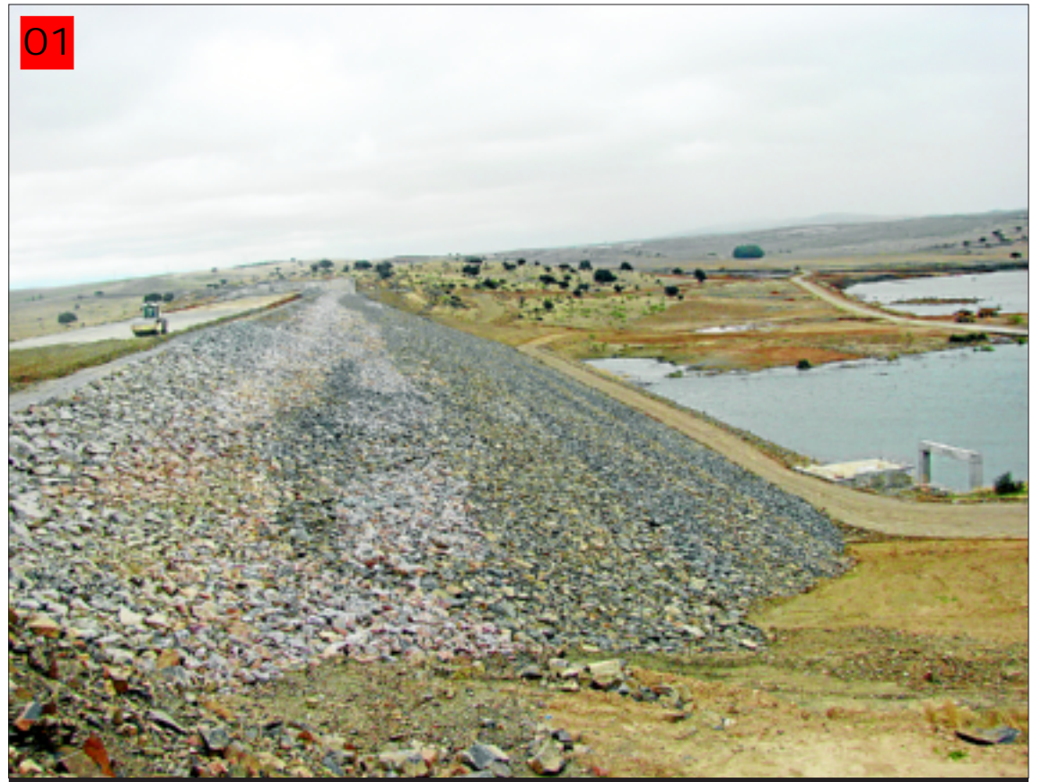
Obras de la presa de Villalba hace unos meses.