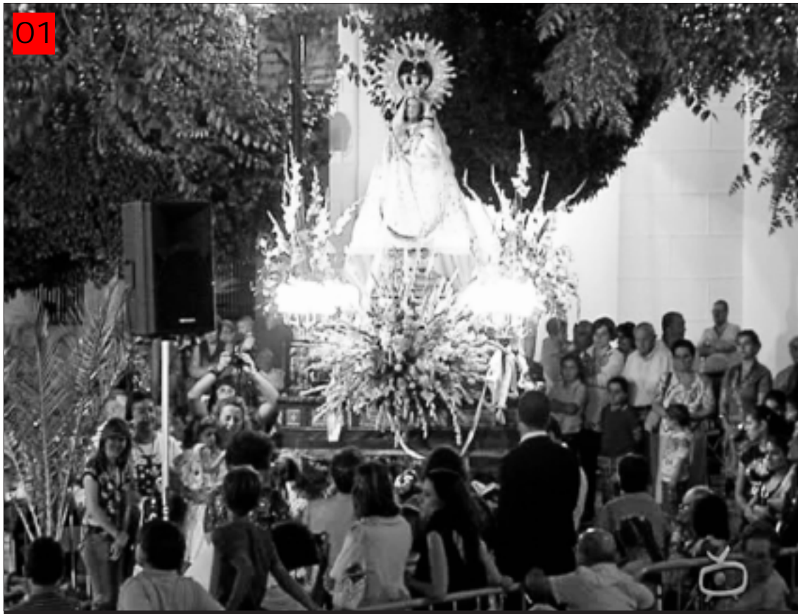
Platos tan vistosos como éste en la noche gastronómica de Villafranca.

El cambio de ubicación al Polideportivo Municipal no impidió que la quinta edición de Gastronomía se desarrollase con total normalidad. Fue una noche llena de sabores, olores y música, donde reinó el buen ambiente y donde todo salió a pedir de boca. Doce fueron los restaurantes participantes, todos ellos satisfechos de su participación, ya que ésta mágica noche les ayuda a promocionarse y a compartir experiencias y convivir con otros restaurantes de la región. Para ellos es una experiencia muy positiva. Y como se auspiciaba, y al igual que en años anteriores, la noche transcurrió con el mejor ambiente y entre los distintos sabores y la música que este año puso el músico villafranqués Felipe Pertegal. A los postres se proyectó un reportaje sobre la historia de estos cinco años de Gastronomía. Tras ello se procedía a la entrega de distinciones a los 12 restaurantes participantes: Apicius, de Mérida; Asociación Extremeña de Cortadores de Jamón, de Alburquerque; Come y calla, de Badajoz; Eustaquio Blanco, de Cáceres; Hospedería Doña Mariana, de Llerena; Maxi, de Villafranca de los Barros; La Gran