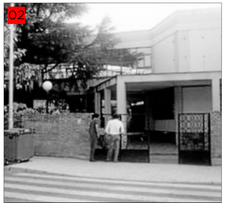
Exteriores del Centro Universitario Santa Ana.