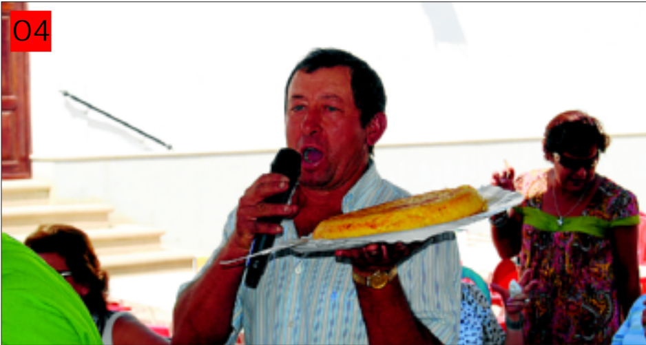
04 En septiembre, la Virgen de Gracia Las fiestas de septiembre de Santa Marta son las de la Virgen de Gracia, que este año se han celebrado desde el 4 al 8. El último día se celebró un concurso de tortillas.