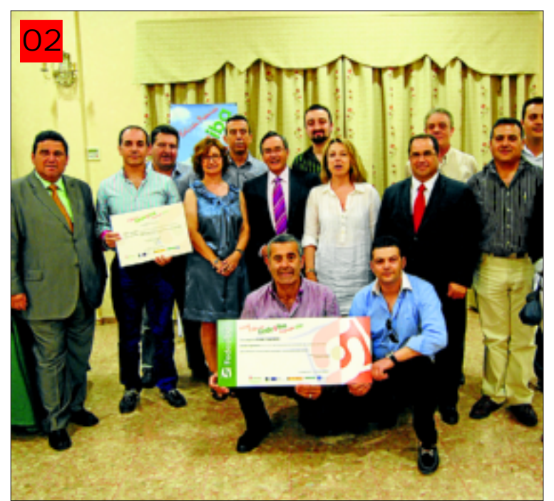
Directivos de Adesam y miembros del Ayuntamiento y FEDESIBA.

–Aporta algo de confianza en que lo que se pueda obtener en estos tiempos que corren. Al estar unidos tenemos más posibilidades de acceder a la información y al asesoramiento, puesto que en solitario es un poco más difícil. Además intentamos ir introduciendo la cultura de la unión y colaboración entre to-