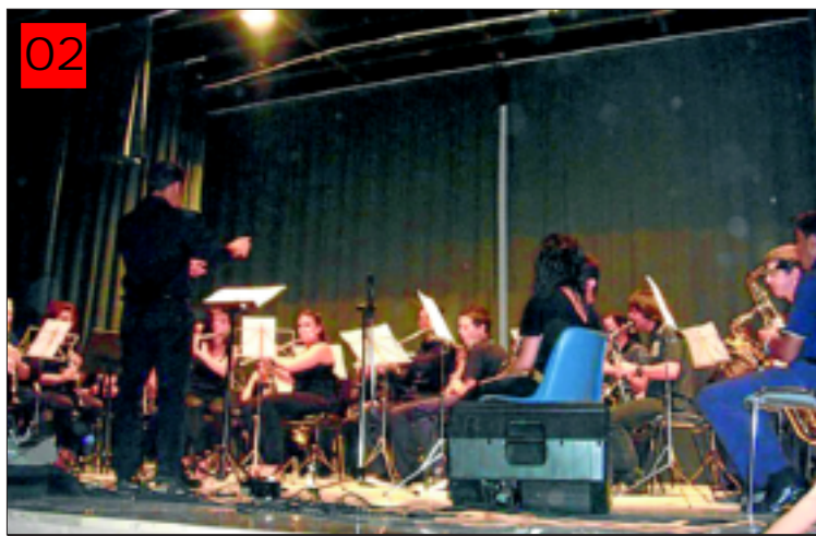
Actuación de la Banda Municipal de Música

El Aula de Banda del Ayuntamiento de Aceuchal inicia el nuevo curso 2011/2012, y abre el plazo de inscripción de la Banda Municipal de Música. El plazo se abrió el día 26 de septiembre, y podrán inscribirse en el Ayuntamiento o llamando a los números de teléfono 607417647 ó 679534885. No existe límite de edad. Cuentan con amplia flexibilidad y horarios personalizados, impartándose las siguientes especialidades: trompeta, trombón, trompa, bombardino, tuba, percusión, flauta, clarinete, saxofón y oboe. Si te apetece aprender a tocar alguno de estos instrumentos, perfeccionar, o participar formando parte de los conjuntos instrumentales y de la Banda Municipal de Música, este es el mo-