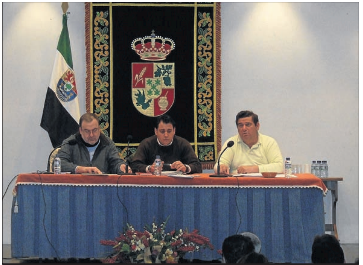
La reunión se celebró en la Universidad Popular de Santa Marta.