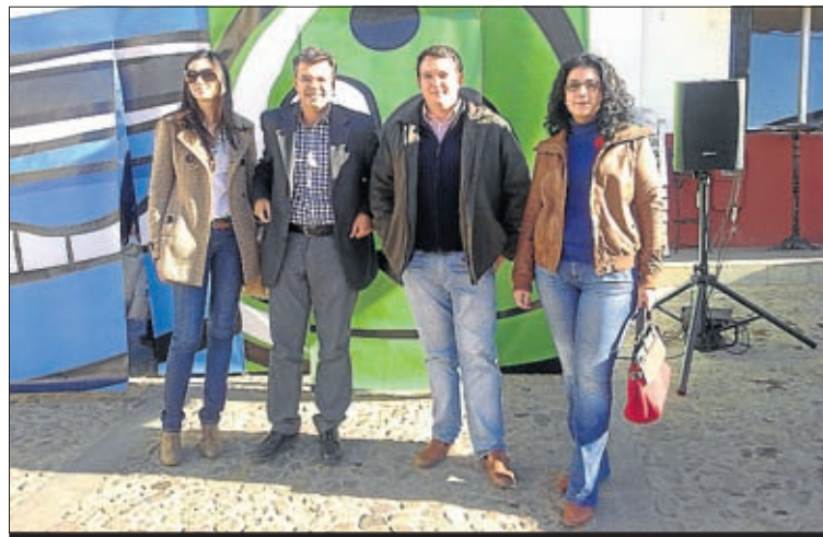
El vicepresidente de Promedio junto al alcalde de Hornachos.

Durante la jornada del martes 29 de noviembre, Promedio (El Consorcio de Gestión Medioambiental de la Diputación de Badajoz), puso en marcha una campaña de información sobre el reciclaje de residuos, con el fin de concienciar acerca de la importancia de separar la basura. No lo hace solamente en Hornachos, sino que también las localidades de la provincia de Badajoz que tienen delegada la gestión de residuos sólidos urbanos entran dentro de esta campaña que consiste en la instalación de una serie de stands informativos sobre el reciclaje en envases, papel y vidrio. Además, Promedio ha programado charlas informativas en los colegios de primaria para acercar la cultura del reciclaje a la población en