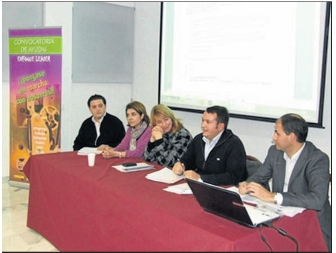
Sesión de cambio de junta directiva de ASIROMA en Villafranca.

También se trató la continuidad y relanzamiento del proyecto de recuperación de huertas moriscas, con una vertiente más empresarial y de creación de empleo que nunca.