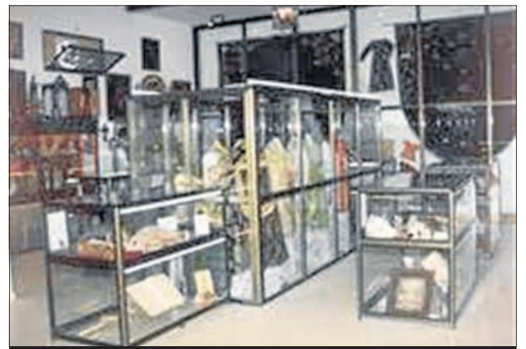
Sala del Museo Devocional Almendralejo

calor de las llamas. El alcalde animaba a toda la población a participar de una fiesta que es de todos. Después del encendido, se procedió a la traca de fuegos artificiales que daban señal al resto de candelas. Por su parte, la AACCF Tierra de Barros, dentro de caseta, animaba a todos los asistentes con el baile de algunas de las academias que mantienen en los colegios gracias al convenio con el ayuntamiento, al mismo tiempo que se disfrutaba de las bebidas y comidas típicas de este día.