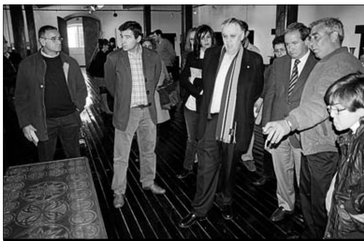
El alcalde de Villafranca con autoridades en la exposición de artesanía.