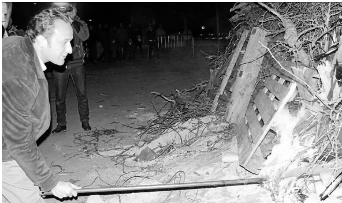
Almendralejo es la población de Tierra de Barros donde la Fiesta de las Candelas tiene un sabor especial. Esta fiesta está declarada de Interés Regional, Ven al alcalde prendiendo el fuego el 1 de febrero.