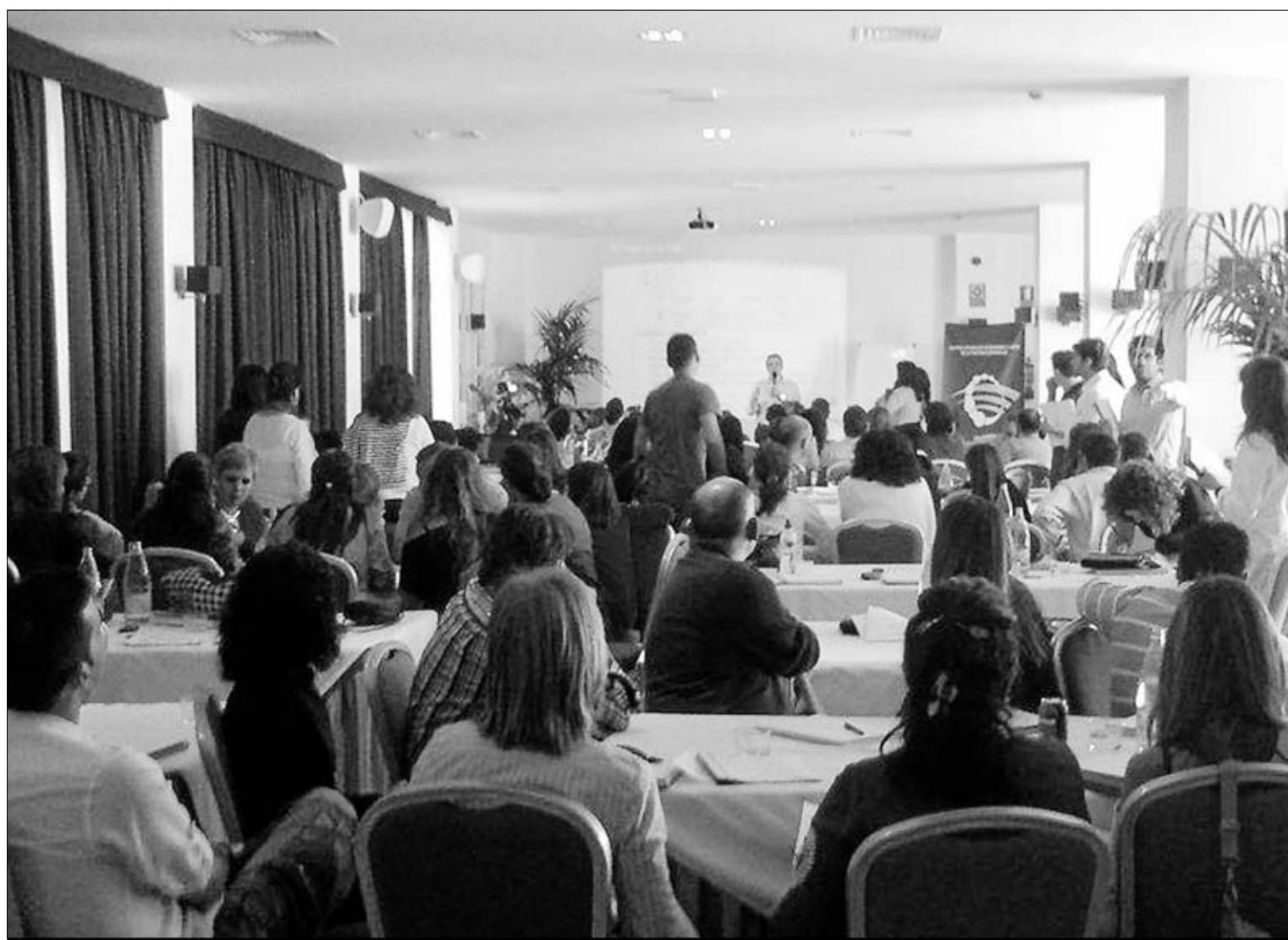
Reunión de los técnicos de la Red Aldea durante su periodo formativo.