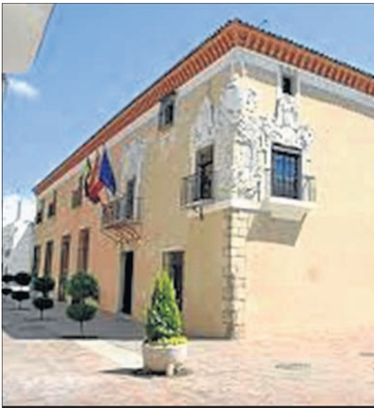
Exteriores del Ayuntamiento de Almendralejo.