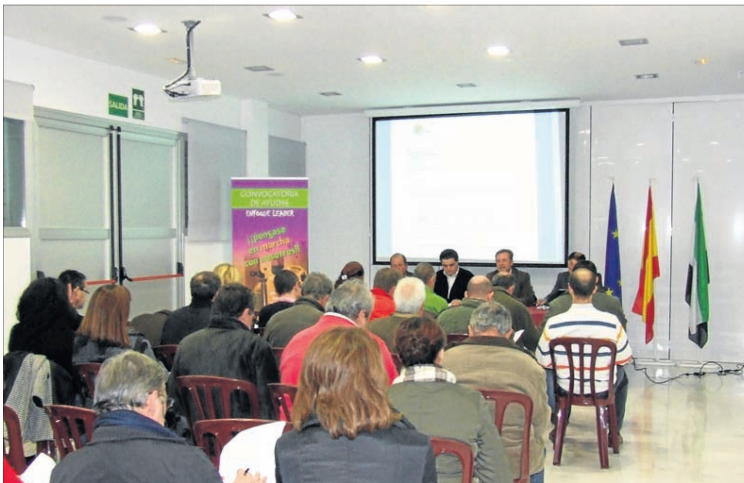
Sesión de cambio de junta directiva de ASIRIOMA en Villafranca.

COFINANCIA FONDO FEADER MEDIDA 323 POR EXTREMADURA 2007-2013