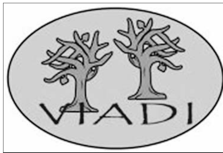
Logo corporativo de VIADI.

cena este musical, está formado por 40 personas, entre actores, bailarines y personal técnico, con edades entre los 16 y los 45 años, que trabajan ya para que todo esté a punto para finales de marzo, fecha en la que se presentará y estrenará en nuestra localidad. El guión, la música y las canciones son originales, sus autores trabajan ya en ellas desde el mes de noviembre. Una vez estrenado en Villafranca, el musical recorrerá localidades cercanas y si es posible, de fuera de Extremadura.