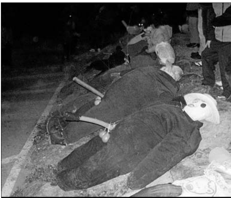
Los peleles ‘Compadres’ tienen unos atributos exagerados.