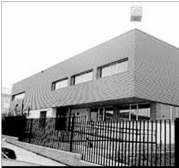
Exteriores de la oficina del Sexpe de Almendralejo.

A lmendralejo registró un número de 1.238 contratos más durante el pasado mes de enero, según los datos facilitados por el Servicio Público de Empleo Estatal. En este caso, la mayoría de ellos se han realizado a hombres alcanzando los 832, frente a las 406 mujeres que se contrataron en la localidad. Por su parte, los contratos temporales vuelven a ser los que predominan, frente a una minoría de indefinidos. Además, en cuanto a los sectores donde se han llevado a cabo la mayoría de ellos, destaca la agricultura, seguida del sector servicios y la industria, quedando la construcción en último lugar. De los datos publicados por el Sexpe también se desprende el número de desempleados, que alcanzan los 5.208 en Almendralejo, lo que supone un incremento respecto al último mes de 31 personas más inscritas en el Servicio Extremeño Público de Empleo. En este caso, la