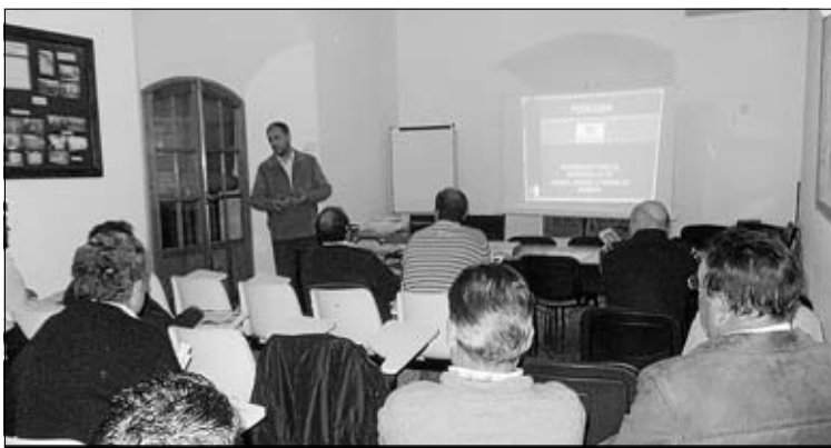
Ribera del Fresno celebra sus IV Jornadas Ganaderas.