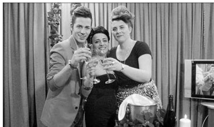
Santa Marta Televisión emitió una gala de nochevieja el 30 de diciembre en la se resumió lo mejor de los artistas de 2011.

La navidad también es buena época para las promociones, junto a esta carroza de "Compra en Hornachos" hubo otras cinco que acompañaron a los Reyes Magos, en la cabalgata del 5 de enero a la que fue mucho público.