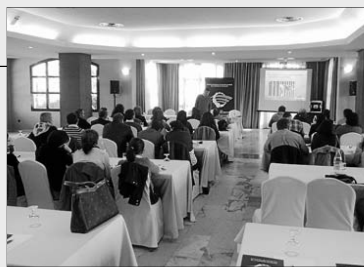
Una de las sesiones formativas del Red Aldea.

Comenzó el 20 de septiembre de 2011 y finalizó el pasado 15 de diciembre. Se desarrolló en las siete mancomunidades donde está implantado el ROT.