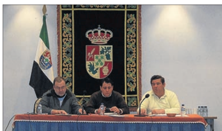
Momento de la reunión en la Universidad Popular de Santa Marta.