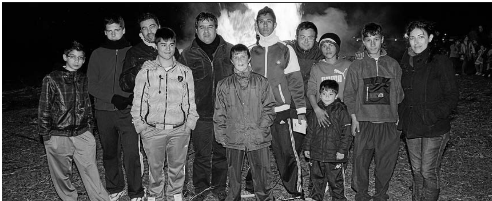
El Ayuntamiento de Santa Marta organizó el tradicional concurso de Candelas y también el de fotografía, que aún está vigente hasta el 17 de febrero. La candela ganadora del concurso fue la que se encontraba en la avenida de San Isidro. En esta fotografía, pueden ver a parte de la corporación municipal durante su visita a la segunda clasificada.