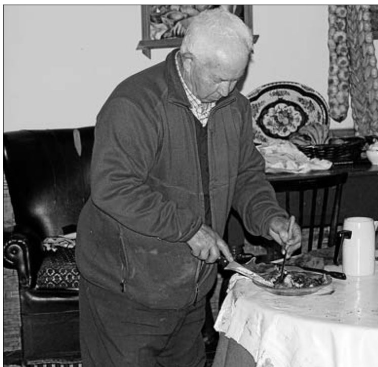
Matancero probando el pestorejo.