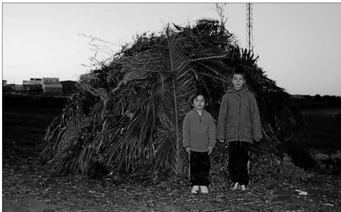
Los niños son los principales responsables de que esta tradición siga viva. Niños tan pequeños como estos que han estado semanas acarreado para presentar así de frondosa su candela al concurso.