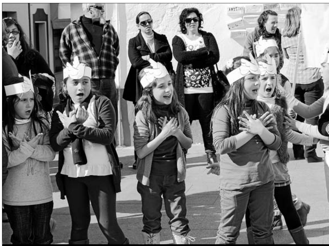
Los niños del C.P. Nuestra Sra. de Gracia escenificando la coreografía

tranquila. Entre las actividades que programó la Asociación de Madres y Padres San José de Calasanz sobresalieron los juegos tradicionales, como el pañuelo, la trolina o el paracaídas, con el que los niños, junto con una de las monitoras de Colorín Colorado, fueron dando lugar a figuras y creando un espacio de ilusión y sueños. Además, los niños pintaron sus caras con los dibujos de sus personajes preferidos, como Spiderman, Hello Kitty y por supuesto, princesitas. No faltaron los globos, que en las manos de otro de los monitores, tomaban forma de perritos, corazones y es-