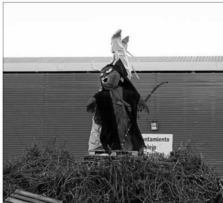
Pantaruja de la candela oficial. Las pantarujas simbolizan todo aquello de lo que queremos desprendernos.