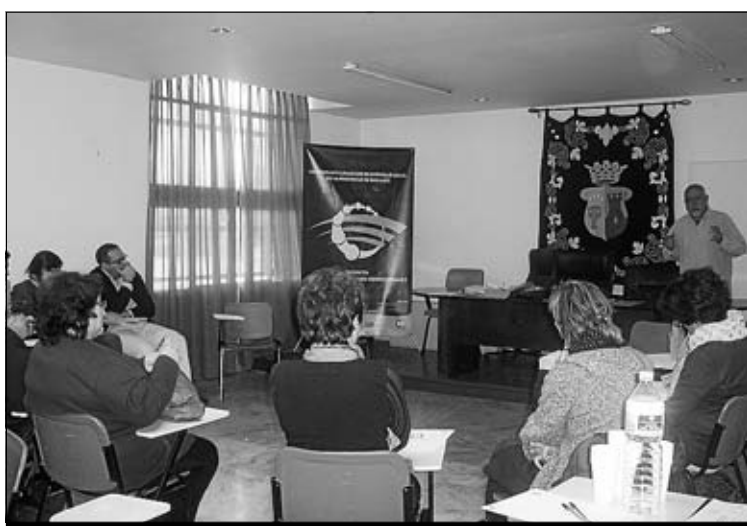
Esta iniciativa está subvencionada por los fondos FEDER en un 70%.