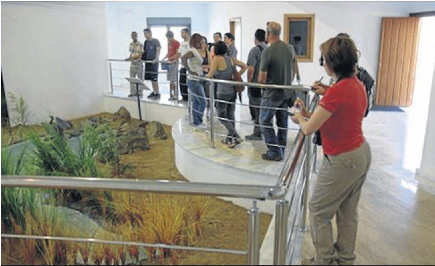
Los alumnos de Emplea-t visitan un centro de interpretación de la zona.

Prueba de ello son las casi 60 salidas realizadas para visitar to-