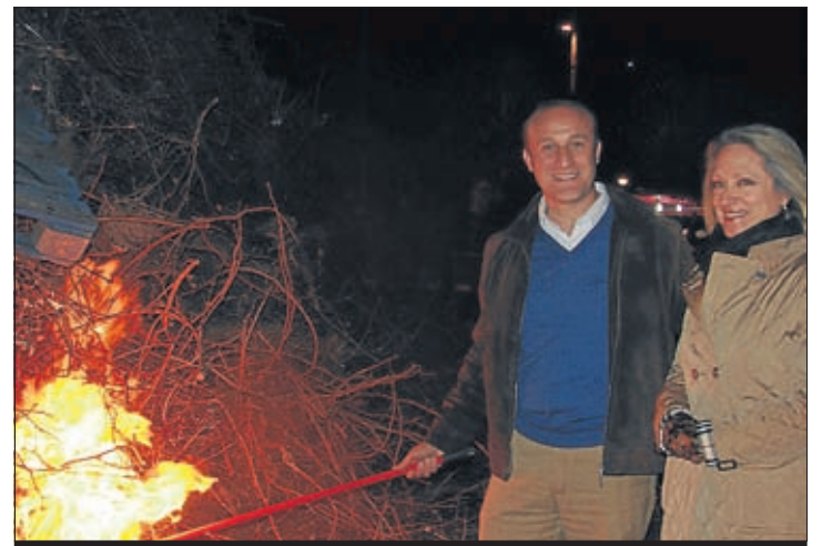
El alcalde de Almendralejo y la concejala de Festejos.

reunión para debatir cuáles son las medidas que llevarán a cabo durante los próximos meses. Será el próximo viernes 17 a las 20.00 horas en el Centro Cívico.