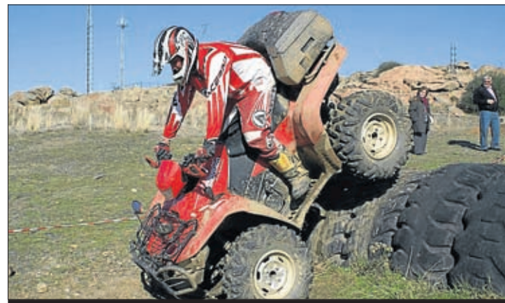
Motero superando uno de los obstáculos.