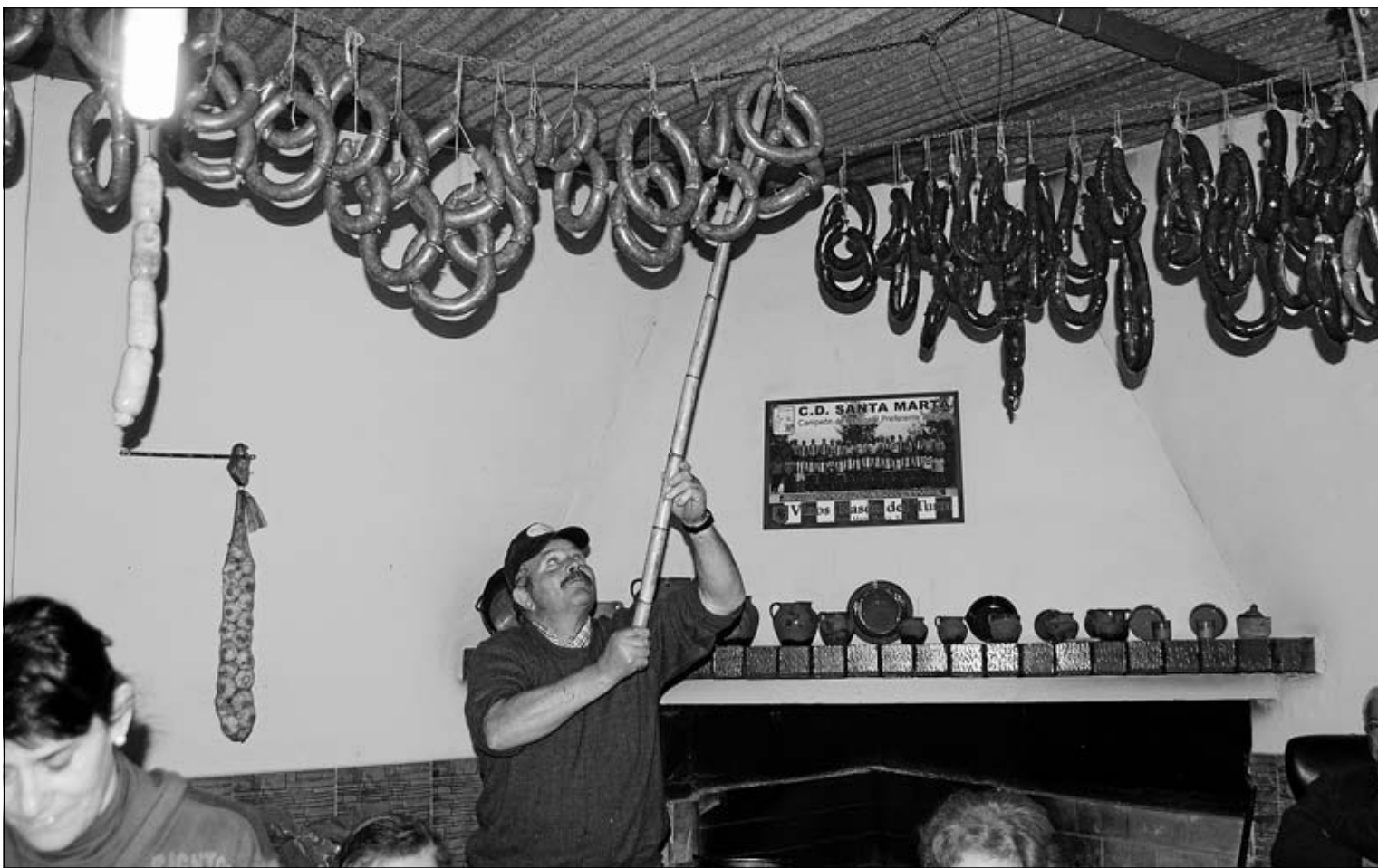
De dos en dos los embutidos se van colgando para que se curen bien