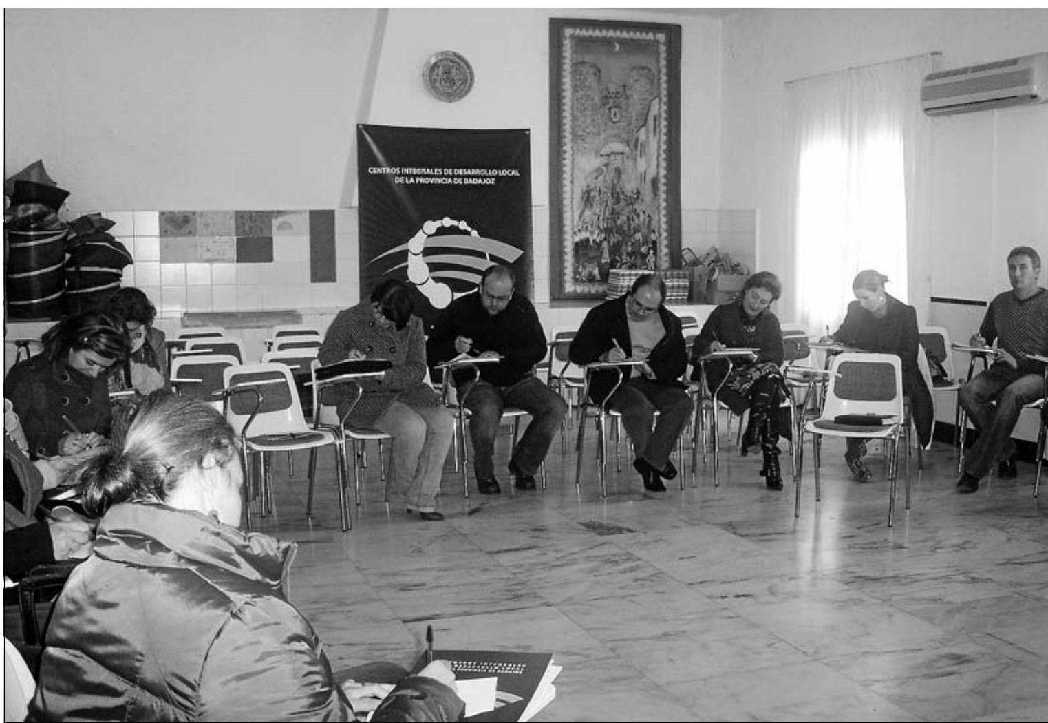
Reunión de técnicos del proyecto Coopera Local para mejorar los modelos de organización del trabajo para el desarrollo local.

Este proyecto, que impulsará la puesta en marcha de la Red de Agencias de Desarrollo Estratégico de la provincia de Badajoz, se dirige y busca la im-