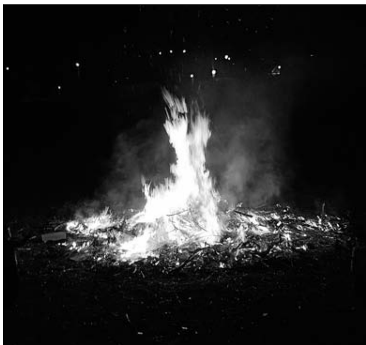
En Santa Marta también se pudo disfrutar de las Candelas. La quema fue el 2 de febrero. Esta fotografía es de la ganadora.