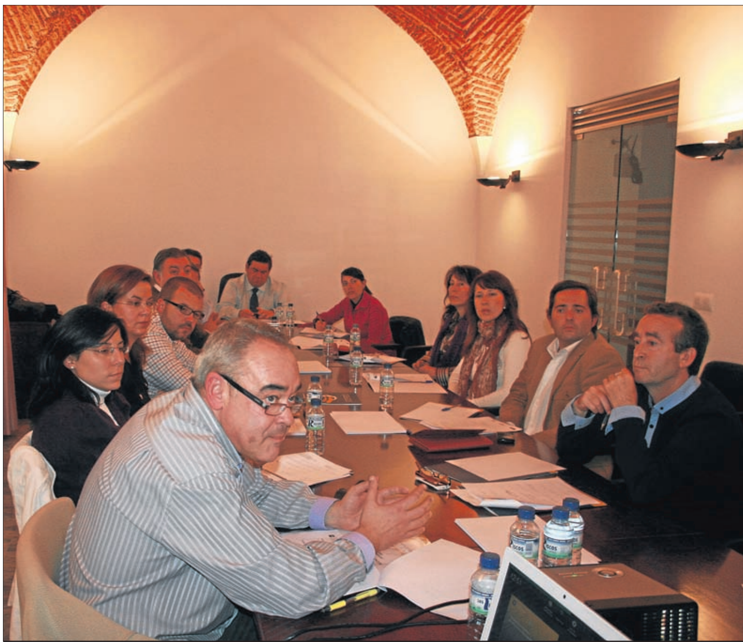
Reunión de técnicos del Plan Municipal de Participación.

Define estrategias del Ayuntamiento con relación al fomento de la participación