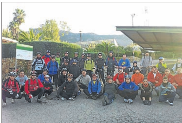
Participantes en esta novena Marcha Cicloturística.