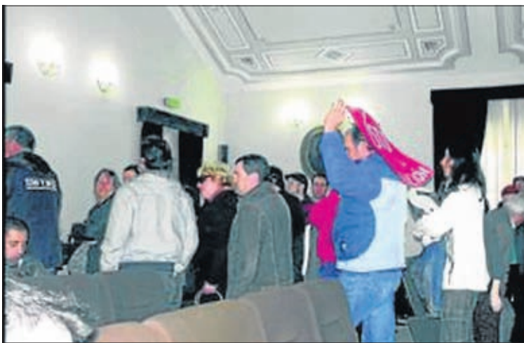
Miembros del 15-M en el salón de plenos.

El Movimiento 15-M también se opone a ceder la gestión de los servicios públicos, por lo que también participó en la reunión mantenida entre todos los colectivos citados. La portavoz de