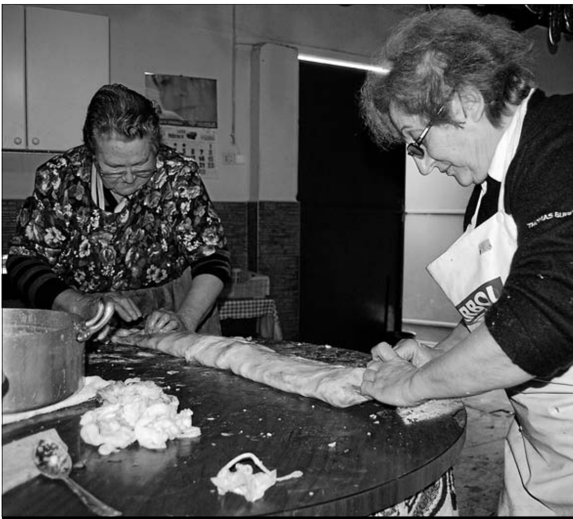
Matanceras haciendo los lomos