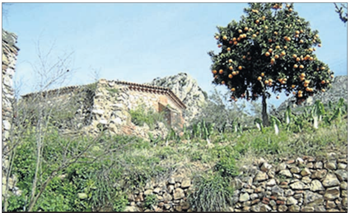
Huerta piloto situada en Hornachos.

El ‘Proyecto de Revalorización de Huertas Moriscas’ comenzó a gestarse en 2001, sin embargo, no ha sido hasta el año 2005-2006 cuando realmente comenzó a ser algo tangible, gracias a la ayuda que la Fundación La Caixa pro-