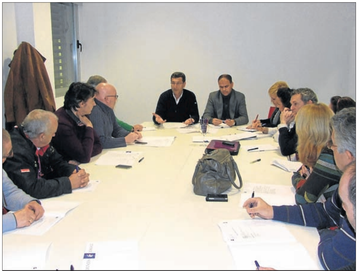
El objetivo de la reunión es trabajar de forma coordinada para el verdadero desarrollo local.

-Espacios para mejorar la organización -Crear servicios que den respuestas a las necesidades -Ser PUENTE entre el territorio y la administración pública y establecer canales de comunicación