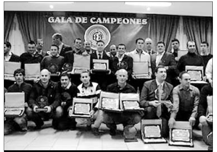
Ganadores en diferentes categorías de la competición.