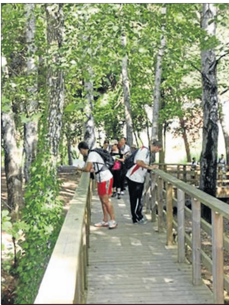
Las visitas a todos los recursos han permitido realizar una guía trilingüe.

dos los pueblos de la comarca de la Campiña, así como las poblaciones y lugares más significativos de las comarcas limítrofes (Tentudía, Río Bodión, Tierra de Barros, Valle del Guadiato en Córdoba y Sierra Norte en Sevilla), igualmente se han realizado visitas a la vecina Portugal.