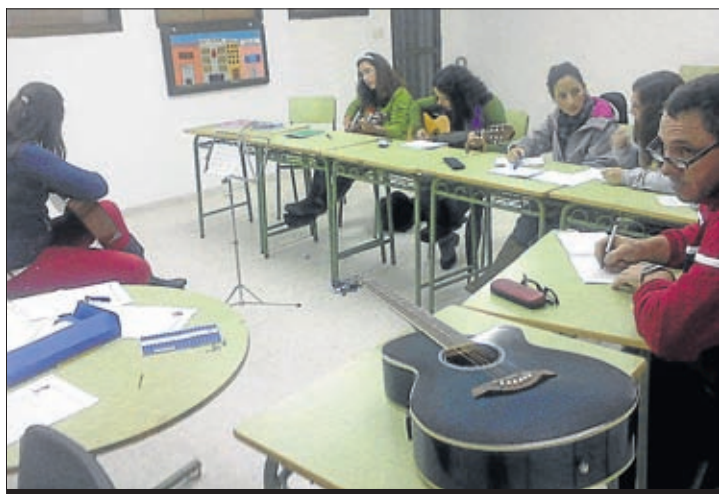
Algunos de los alumnos de la Escuela de Música.

mañana, dirigiéndonos desde el polideportivo municipal, por la carretera de Campillo, hasta la entrada del camino de trasierra. Por éste rodeamos la sierra hasta enlazar con el camino del puerto, pasamos por San Isidro, llegando a las calles de nuestro pueblo por el Pilar de Palomas, finalizando la ruta en el Paseo de la Virgen. A mitad de camino disfrutamos de una merienda en pleno alcornocal. En total fueron alrededor de 25 kilómetros de sana convivencia deportiva, sin perdedores de ningún tipo.