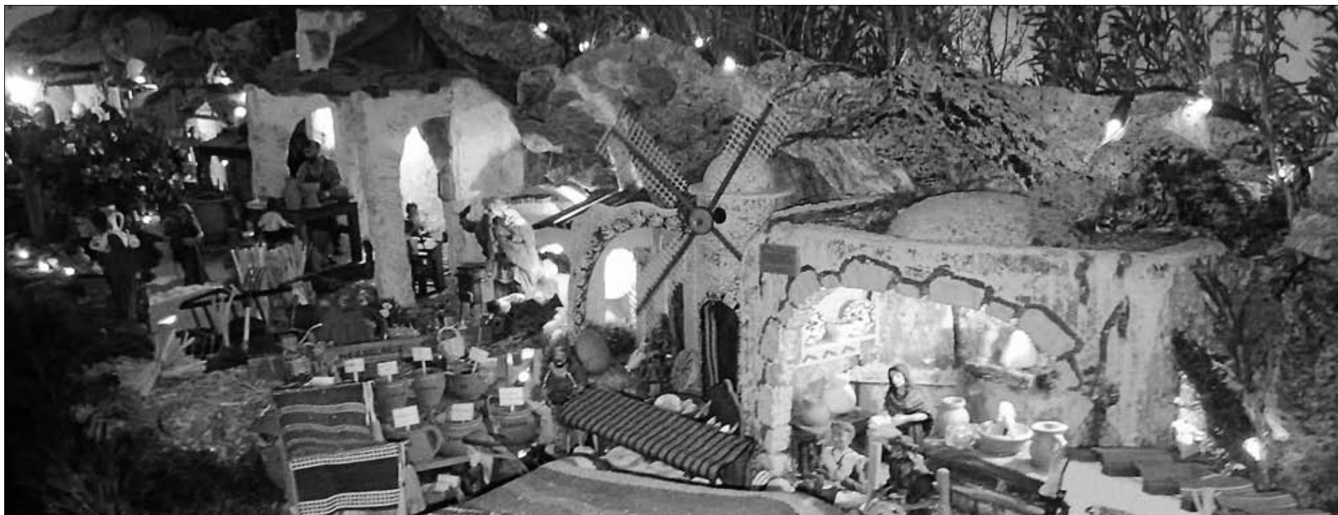
Las navidades son esas en las que aflora lo mejor de nosotros y una de esas facetas positivas es la elaboración los belenes. Muchas son las casas en las que puede disfrutarse de esta tradición que nos llegó de Italia. El que ven en esta fotografía es el ganador del Concurso de Belenes de Hornachos.

Los niños de Santa Marta vivieron unas navidades animadas, en la que contaron con muchas actividades para divertirse. Pero sin lugar a dudas, la cabalgata es el acontecimiento que más esperan y con el que más disfrutaban. Este año, el Ayuntamiento ha reducido el recorrido de la cabalgata para que la entrega de regalos, que se celebra después en la plaza de la Constitución por parte de los Reyes Magos, no se retrasara mucho y calmar la impaciencia de los niños.