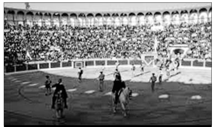
Corrida de toros de una de las últimas ediciones del Salón.