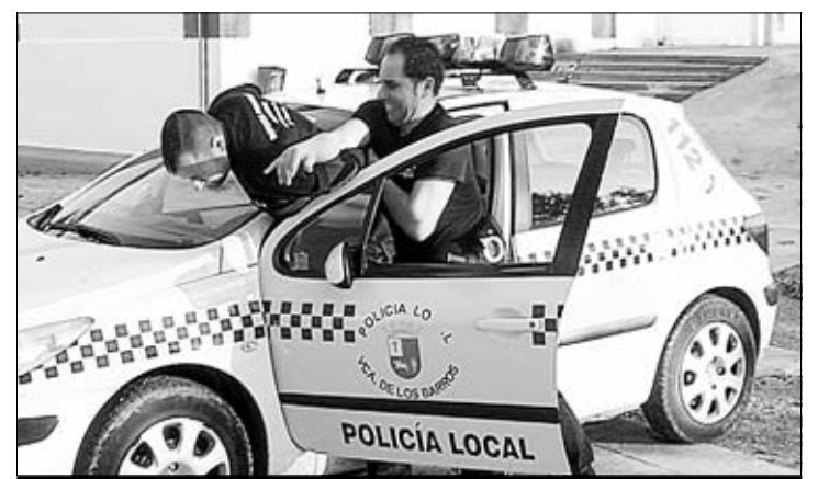
Agentes de la Policía Local en una demostración.

ción profesional", afirmó. Y, con estos cursos, se busca "el relevo generacional en los talleres artesanos para asegurar su continuidad en el futuro".