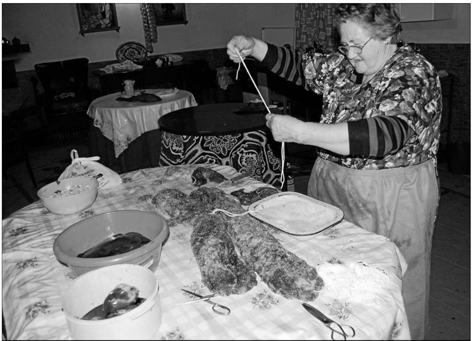
Matancera preparando los lomos.

Como no podía ser de otra forma, para que haya matanza, tiene que existir un cerdo, generalmente haya sido engordado con pienso (de cebada, maíz, soja, etcétera) o con bellotas, o mediante ambos alimentos, hasta que alcance las doce o trece arrobas (o más) de peso. Una vez que tenemos al cerdo a punto y nos acercamos a las fechas más frías del invierno, podemos comenzar nuestra matanza. Suelen celebrarse entre los meses de noviembre y febrero, puesto