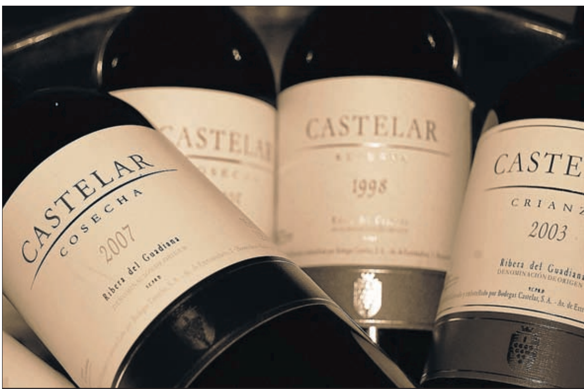
Castelar tiene tantas variedades de vino como de uvas hay en Tierra de Barros.

–¿Qué importancia tiene para su negocio el emprendimiento?