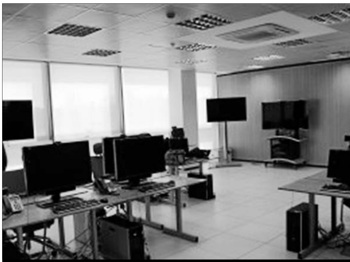
Interior del Centro de Tecnologías de la Información y Comunicación.

El Centro Demostrador de las Tecnologías de la Información y la Comunicación prevé, en concreto, la presentación sucesiva de aplicaciones de probada eficacia relacionadas con los ámbitos del comercio electrónico, el marketing on line y posicionamiento en Internet, gestión empresarial, utilidades bluetooth en dispositivos móviles, sistemas de interac-