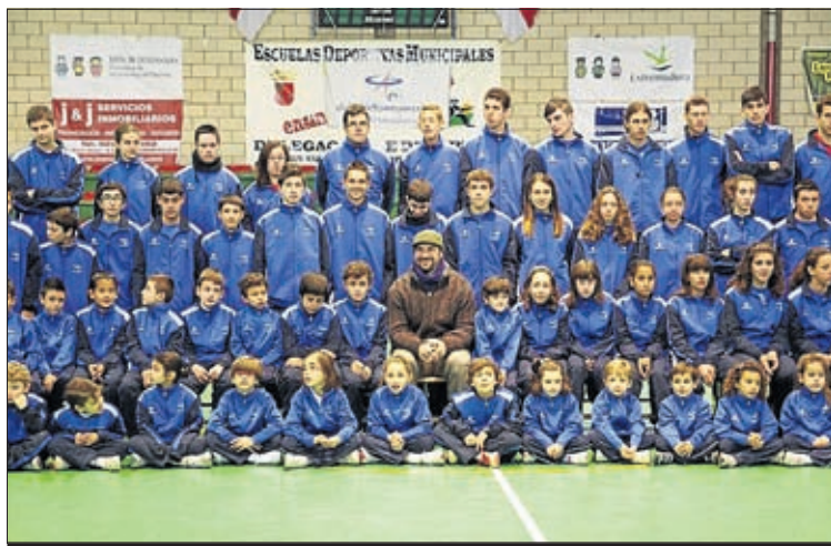
Alumnos de la escuela de Atletismo Perceiana de Aceuchal.

para presentar el equipamiento oficial de la escuela que estará patrocinada por la marca deportiva KELME.