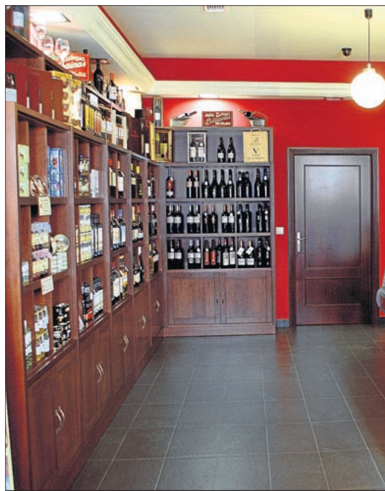
El proyecto de la Despensa del Museo se presentó en 2011.

La Despensa del Museo pretende promover y desarrollar el interés por el patrimonio turístico y gastronómico de nuestra Comarca, gracias a diferentes actividades: