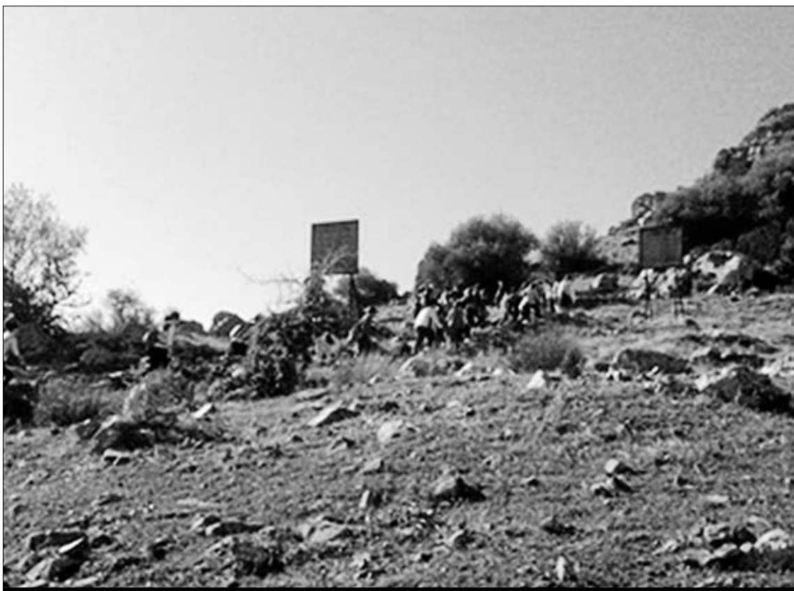
Los niños se divirtieron a lo grande disfrutando de la naturaleza.

DIVERSIDAD Encontramos en este espacio una gran diversidad de hábitats: zonas estépicas con gramíneas y hierbas anuales, retamares y matorrales, formacio-