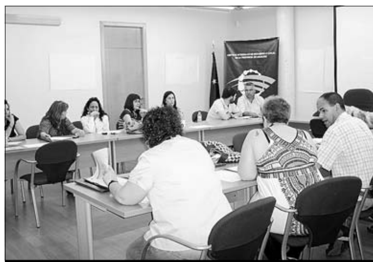
El objetivo es una mayor cohesión económica, territorial y social.

Propone la mejora consensuada de los modelos de cooperación técnica