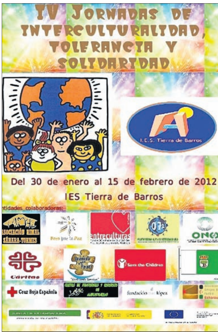
Cartel de las Jornadas Interculturales del Instituto Tierra de Barros.

Desde el día 30 de enero se vienen celebrando en el IES Tierra de Barros de Aceuchal la IV Jornadas de Interculturalidad, Tolerancia y Solidaridad, que se prolongaron hasta mediados de febrero. Se trata de unas jornadas con diversidad de actividades para fomentar en los alumnos del centro actitudes de respeto y solidaridad con respecto al entorno más próximo y también a realidades muy lejanas y distintas. Forman parte del programa REVIVE y cuenta con la colaboración de diversas asociaciones, ongds, el Centro de Profesores de Almendralejo, el Ayuntamiento de Aceuchal así como con la financiación de la Consejería de Educación y Cultura, Gobierno de España y Fondo Social Europeo a través del PROA. Entre las actividades de las jornadas hay 5 exposiciones perma-