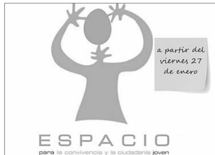
Logo del ECCJ de La Zarza

En ella, los vecinos del municipio se agrupan en torno a grandes fogatas, y alrededor de las mismas sus habitantes pasan la gélida noche de febrero comiendo chorizo y sardinas asados en el calor de las brasas; así como bebiendo los tradicionales vinos de la tierra.