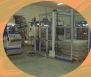
Termoplásticos Extremeños, S.L.

123. Aumento del valor añadido de los productos agrícolas y forestales. Nueva creación de quesería artesana de cabra