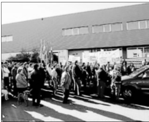
Manifestantes de la Cumbre Social frente al SEXPE.

La Cumbre Social, integrada por más de 50 colectivos, llevó a cabo una concentración en Almendralejo el pasado 28 de diciembre. Lo hicieron frente al edificio del Sexpe para reivindicar ciertas cuestiones como la puesta en marcha de planes de empleo, entre otras cosas. Así, señalan que en las diferentes localidades de la zona de Tierra de Barros existe un desempleo que afecta ya a casi 12.000 trabajadores, más del 33 por ciento de la población en edad de trabajar, y a más del 55 por ciento de los jóvenes. Además, añaden que las previsiones apuntan a que si el Gobierno de la nación y el regional no cambian la política económica y no ponen en marcha estos planes, el paro seguirá creciendo sin detenerse. Además, aluden a que el principio básico y fundamental para cambiar la política que se está aplicando es la participación de los diferentes