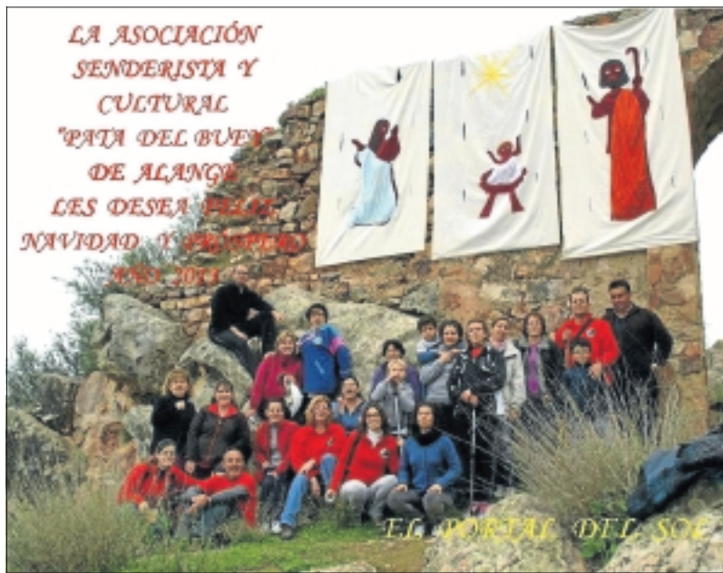
La Puerta del Sol ha sido el lugar seleccionado para el portal.