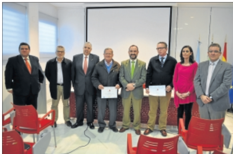
Foto de familia con las cooperativas reconocidas.