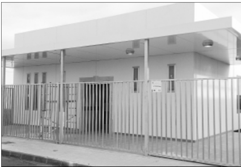
Exteriores del nuevo velatorio de Ribera del Fresno.

—Ha evolucionado, como dije antes, en la construcción de tanatorios y de salas de velatorios, algo que hace diez años atrás era, a lo