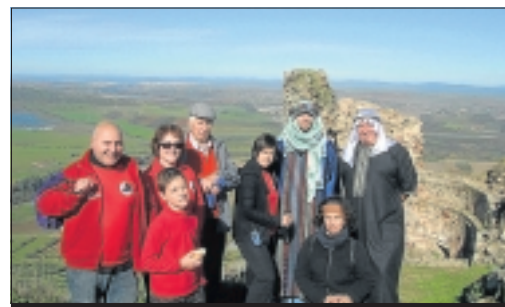
Ibn Marwan, Muhammad I y participantes en la ruta

dujo a los senderistas hacia el Decumanus Maximus de Emerita Augusta, hoy día Calle Santa Eulalia y Ramba de la Mártir, lugar donde la Niña Eulalia con doce añitos sufrió su martirio por haber defendido el cristianismo ante el gobernador romano de la ciudad. Una vez en su basílica, la verdadera imagen de la Mártir esperaba a los viajeros y ante Ella cada peregrino expresó sus sentimientos dándole gracias. Pata del Buey da gracias también a la Asociación de Peregrinos de Santa Eulalia por el detalle de haber regalado los certificados que indican que el 9 de diciembre de 2012 sus integrantes fueron peregrinos de Santa Eulalia de Mérida.