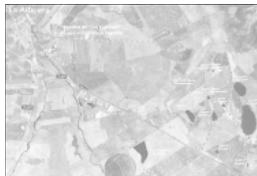
Ubicación territorial de las Lagunas de la Albuera