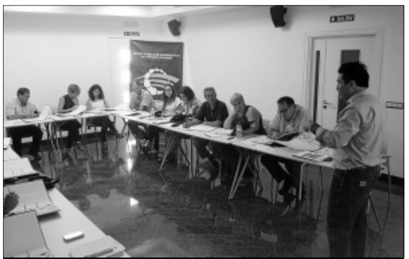
Una clase de Coaching para la Cooperación Territorial.

riencias y cooperación de los agentes implicados, optimizar la coordinación entre las diferentes instituciones, autoridades y administraciones competentes en cada zona para una mejora de los recursos humanos y económicos, responder a los retos que se plantean en los equipos de trabajo de las estructuras del CIT para lograr un trabajo en red, en aras a la constitución definitiva de las Agencias de Desarrollo Estratégico, aumentar la eficiencia e impacto del CIT Zafra-Río Bodión para conseguir su consolidación y sostenibilidad, desarrollar capacidades proactivas de liderazgo, creación de redes y sistemas de gestión para que las acciones redunden en programas y proyectos concretos que favorezcan el desarrollo de la mancomunidad y mantener los valores de solida-