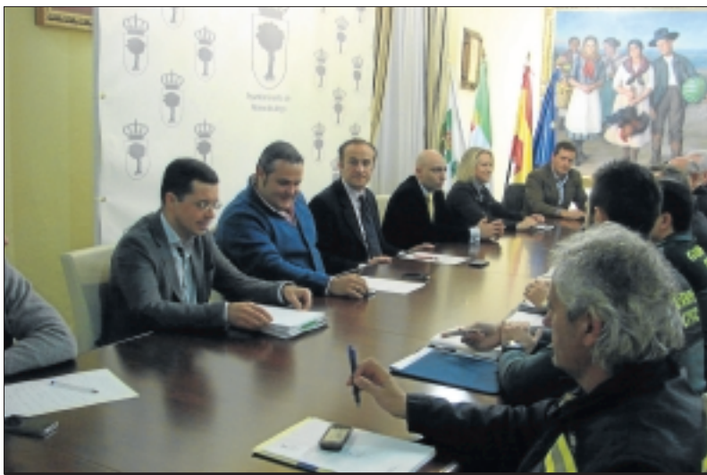
Junta de Seguridad en la que se diseñó el plan de seguridad navideño

El pasado 18 de diciembre se celebró una Junta Local de Seguridad en la sala de comisiones del Ayuntamiento de Almendralejo y que contó con la presencia de los diferentes Cuerpos de Seguridad del Estado –como Policía Nacional, Local y Guardia Civil–, bomberos, Protección Civil, así como una representación de la Delegación del Gobierno y del Gobierno de Extremadura. Así, en la misma se han tratado diferentes asuntos y se ha anunciado que se intensificará la presencia de efectivos de Policía Nacional en las zonas comerciales desde ese día hasta el 8 de enero, a través de un plan denominado 'Dispositivo de Comercio Seguro'. Además, también se ampliará a otros lugares como el mercado de Las Mercedes y el mercadillo. Por su parte, la Policía Local