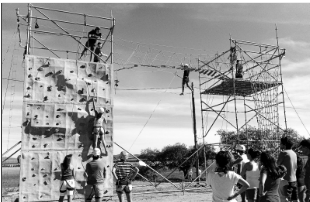
Actividades de multiaventura que se desarrollaron junto a la presa de Alqueva.

Estas actividades, a las que se pretende dar continuidad al año que viene, han estado organizadas y financiadas por los proyectos ADLA y el Plan de Competitividad Turística 'Guadiana Inter-