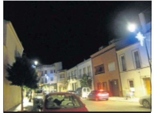
Calle El Pilar de la Zarza.

de juguetes para donarlos a una ONG. La organización del evento correspondió al Ayuntamiento de La Zarza junto a las empresas Ocioextrem y Grupo Alcor.