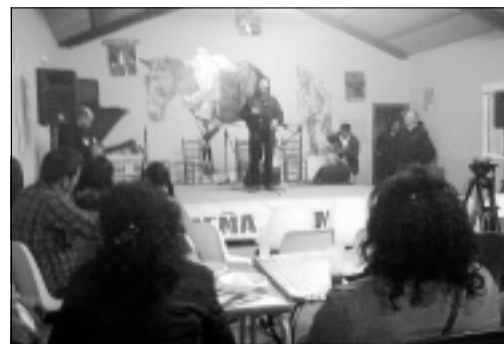
Actuación flamenca del 20 de octubre en la nueva sede.

prevé que su amortización sea efectiva en un año. Esto supone un importante ahorro económico y una drástica reducción de emisiones de dióxido de carbono.