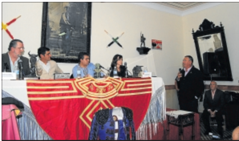
Jesús Janeiro, Jesulín atendió y contestó todas las preguntas del público.