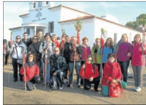
Peregrinos del Club Pata del Buey en el inicio de la ruta.

en escena en dos ediciones, para que con su intercesión cada año la fiesta se haga más grande y consigamos entre todos que no vuelva a desaparecer.