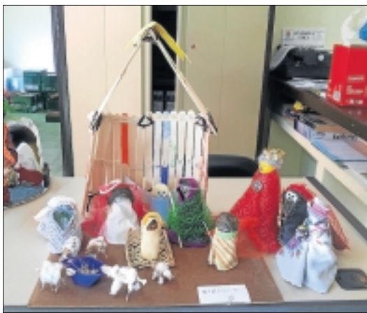
Uno de los belenes participantes de Ribera del Fresno.

Estos belenes se han realizado con material de desecho con el objetivo de disminuir el impacto negativo que genera nuestra basura en el medio ambiente y así promover el reciclado de determinados materiales. El concurso consta de dos partes: Una primera a nivel mancomunado, donde pudieron participar todas las per-