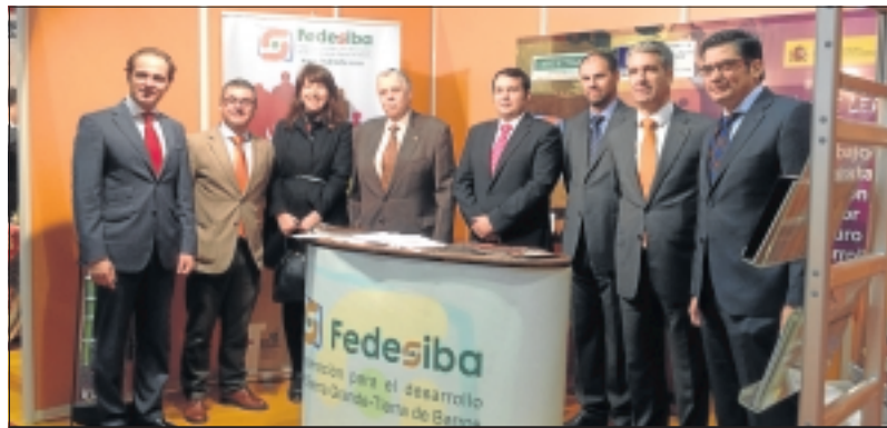
Las autoridades en el stand de Fedesiba en Expobarros.

En Expobarros estuvimos charlando con los empresarios y comerciantes, tanto de fuera como de la localidad, que ya estaban a punto de comenzar a recoger su stand, y para quienes, en general, la feria ha sido positiva, no ya por las ven-