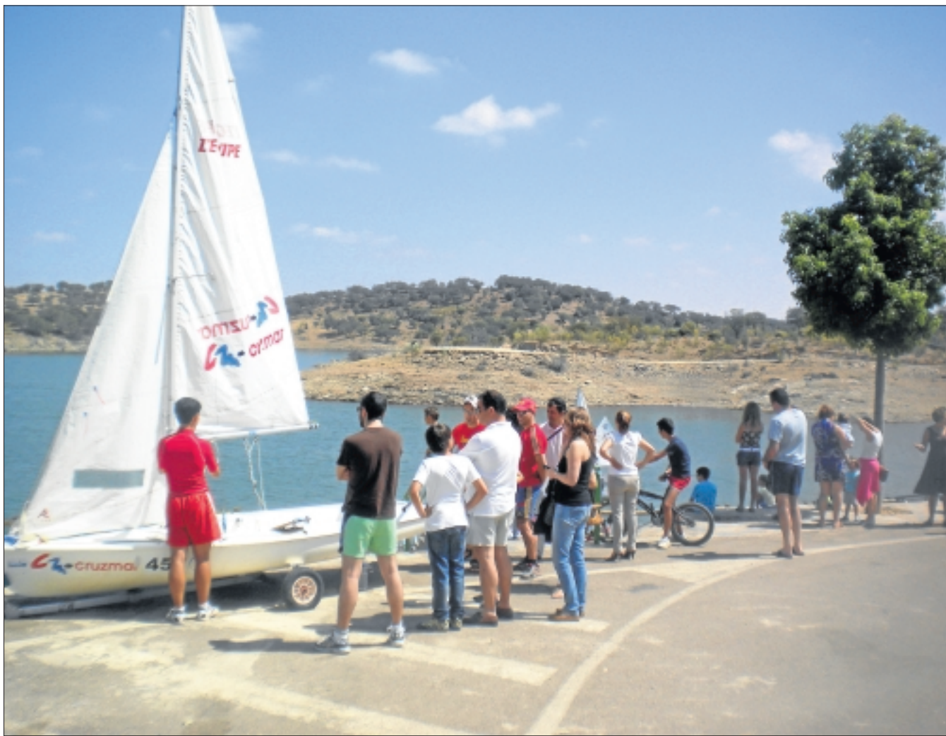
Actividades de aventura acuáticas en la presa de Alqueva.

REPORTAJE • Ha tenido lugar en los embarcaderos de Villarreal (Olivenza), Cheles y Villanueva del Fresno