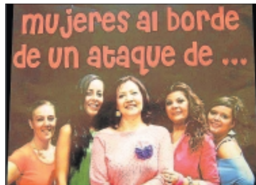
Cartel de 'Mujeres al borde de un...', de Teatro Batilo.

artículos y antigüedades en el mercadillo de segunda mano a un precio reducido esta actividad fue celebrada los días 22 y 23 en el cine de verano.