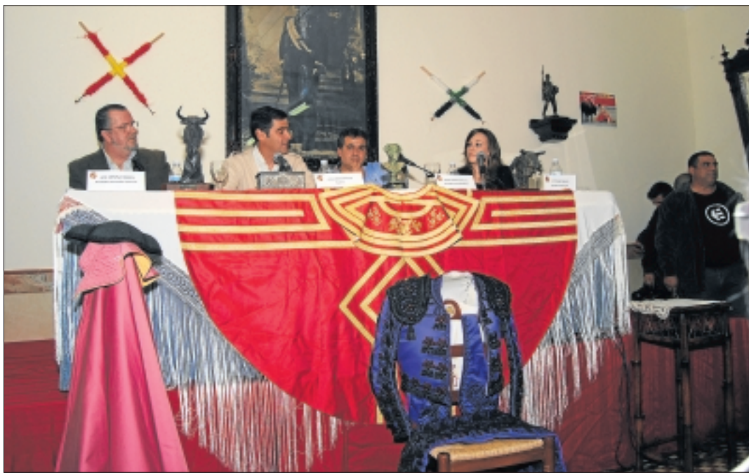
El salón noble del Círculo de Cascorro se engalanó para agasajar a Jesulín.

Sobre la situación del mundo de los toros también opinó, expresando que nunca había visto como ahora los efectos de la crisis en las plazas, puesto que antes se llenaban y en la actualidad, a plazas tan importantes como las Ventas o la Maestranza, les cuesta mucho trabajo colgar el cartel de no hay billetes. Se lamentó de lo difícil que es para los toreros, empresarios y ganaderos (como es él ahora) rentabilizar lo que se invierte en mantener esta fiesta, pe-