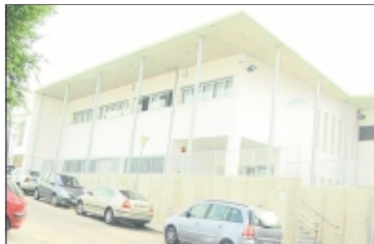
Exteriores del Centro Integral Territorial Tierra de Barros.