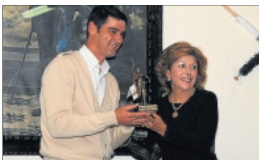
Círculo de Cascorro le regaló su enseña. 'El Cascorro'