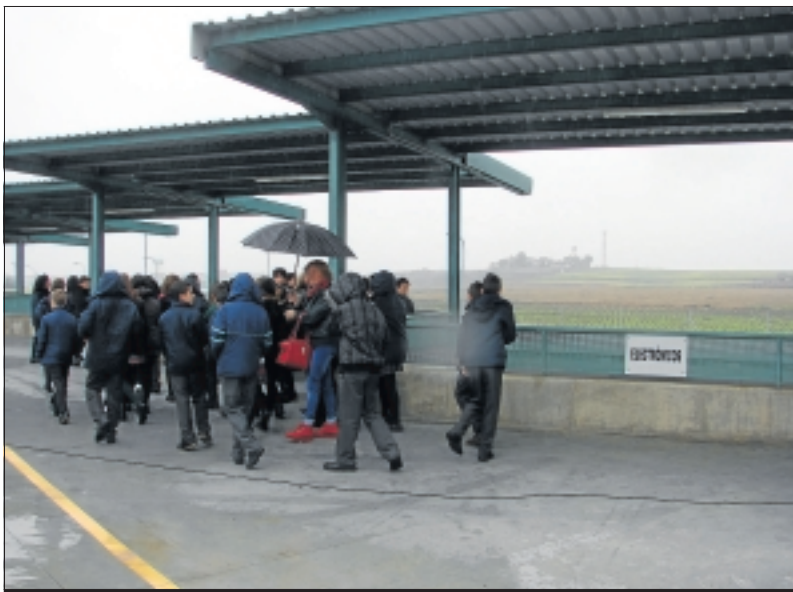
Primeros usuarios del Punto Limpio de Almendralejo.

A lmendralejo inauguró su nuevo Punto Limpio. Son unas instalaciones en las que los ciudadanos pueden depositar aquellos artículos, concretamente entre 22 tipos de residuos, que son susceptibles de ser reciclados. Así, entre ellos hay electrodomésticos, pilas, bombillas, tóner, y una completa variedad que permiten a los vecinos de la capital de Tierra de Barros depositar allí sus residuos durante los fines de semana. En este sentido, ya han sido 40 los usuarios que han acudido a sus instalaciones durante los días que ha permanecido abierto hasta la fecha, siendo los voluminosos y los electrodomésticos aquellos que han sido más entregados. Además, en tor-