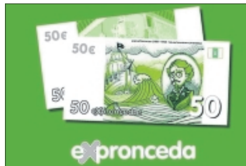
Moneda Expronceda, la moneda social de Almendralejo.

En la puesta en marcha de estas actividades, también están implicados los Grupos de Acción Local de las comarcas; cada CEDER se encargará de revisar la lista de empresas certificadas de su territorio y de proponer la incorporación de las interesadas en participar en el proyecto. El presidente de la Diputación ha manifestado que: "desde la Diputación de Badajoz se quiere apoyar el turismo de la provincia. a través de la mayor y mejor sistematización de la oferta turística disponible, de forma que se articule y se promocio- ne nuestro territorio, particularmente a través de este proyecto, que apoyamos firmemente, de Ruta del Jamón Ibérico de la provincia de Badajoz".