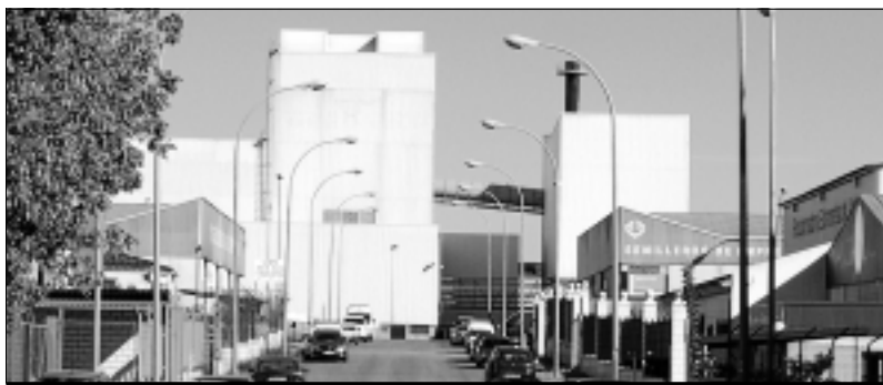
Inmediaciones de la fábrica de Barbosa Vidrio.

tividad actual de la fábrica, así como duplicar el personal y se prevé que arranque su construcción a mediados de 2013, y desde ya, comenzarán las entrevistas para las contrataciones. La inversión que se realizará será 100% con capital de la propia empresa, y el aumento de producción se destinará a la exportación. El alcalde de Villafranca, Ramón Ropero, declaró sentirse un "alcalde feliz". Agradeció públicamente el que la Junta de Extremadura se haya volcado con el proyecto "con su apoyo y con la implicación del Ayuntamiento de Villafranca, hemos conseguido que en un tiempo récord se hayan recalificado los terrenos (200.000 metros cuadrados anexos a la actual fábrica) y organizar toda la estructura administrativa". Para Ropero "ésta es la responsabilidad de las administraciones, trabajar de forma conjunta y estar siempre disponibles para los emprendedores". Las obras comenzarán a mediados de 2013.