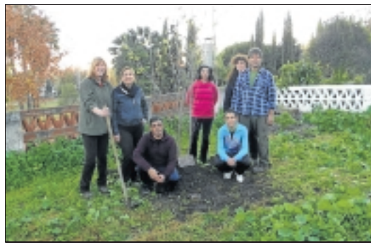
Satisfechos por haber plantado los árboles para San Bartolomé.

X% El árbol de la Asociación Allí quedó plantado el árbol de esta asociación, el cual deseamos que crezca, se haga fuerte y pro-