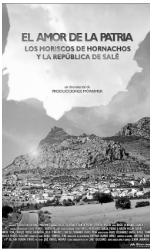
Cartel promocional del documental 'El amor de la patria'.