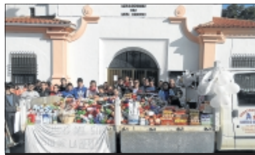
Momento de la entrega a Cáritas.