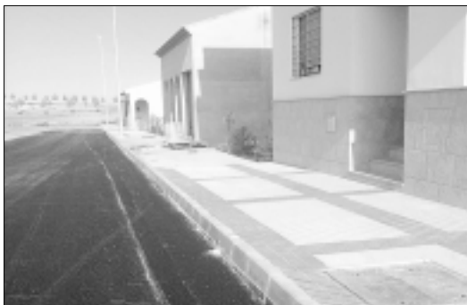
Las Caleñas, nueva zona pavimentada en La Albuera