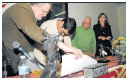
Jesulín no escatimó esfuerzos para complacer a sus seguidores.