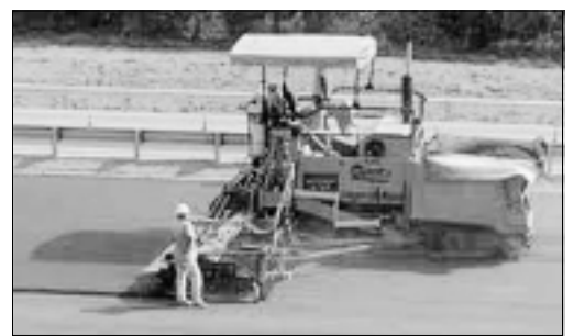
Cartel publicitario del Concierto de Navidad

su nuevo hogar y esperando que estas casas contribuyan a solventar en alguna medida los difíciles momentos que todos atravesamos.