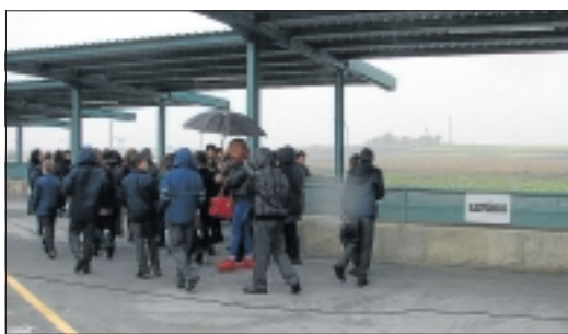
Estos son los primeros vecinos que han hecho uso del Punto Limpio.