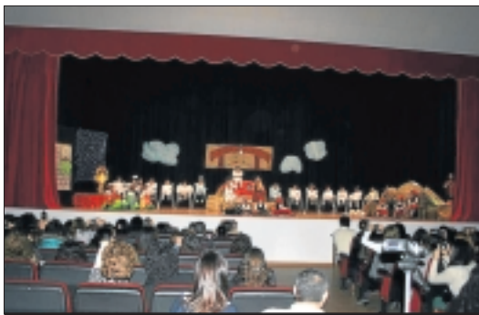
Niños de la guardería Garabatos en el auditorio municipal.

El día 23 de diciembre a partir de las 16.00 horas el grupo de alumnos de catequesis, representó un belén viviente por las calles de la localidad, que finalizó en el paseo del Cristo, donde pudieron degustar y adquirir dulces típicos, en el Mercado Artesanal