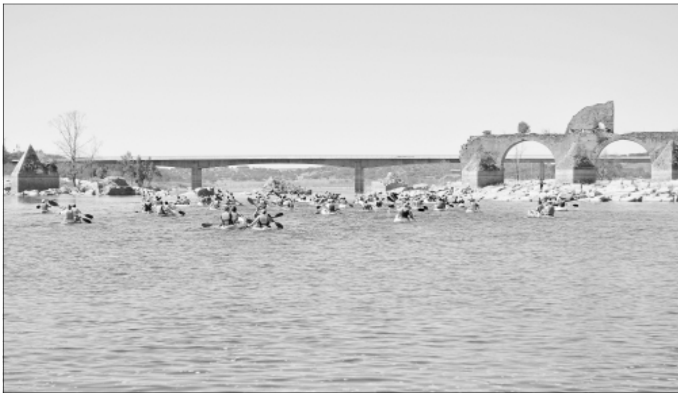
Piragüistas realizando el descenso del Alqueva.