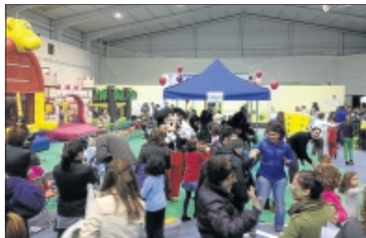
Pequeños de la Zarza divirtiéndose con Mickey Mouse.

El 26 de diciembre dio comienzo la I Feria Infantil y Juvenil de La Zarza, Pequeocio. Pequeocio ha sido un espacio mágico donde la diversión, la solidaridad y la magia se cogieron de la mano. Fue un evento para disfrutar en familia, que ofreció numerosos espectáculos. Dividida en zonas temáticas, los más pequeños y jóvenes pudieron disfrutar de actividades multiaventura como rocódromo, tirolina, escalada de cajas y rappel. En la zona de hinchables se albergaron numerosos hinchables para todas las edades. Pequeocio también contó con distintos talleres, 'bebeteca', zona de videojuegos, animación infantil con los personajes más famosos de la tele, espectáculos de magia y circo en directo, scalextric y