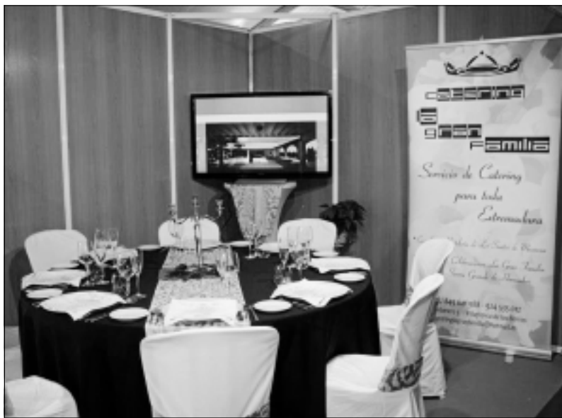
Estand de La Gran Familia en Expobarros 2012

Comenzó su andadura empresarial hace tres años, con el apoyo de sus padres, un apoyo que no ha cesado en las últimas fechas, sino que se ha intensificado.