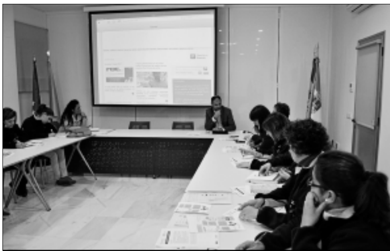
Un momento de la jornada de trabajo con el taller 'Hornachuelos'.