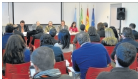
El auditorio del CIT estaba repleto en las jornadas.