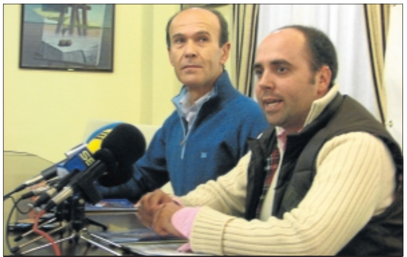
Rueda de prensa de presentación de la revista Harnina.