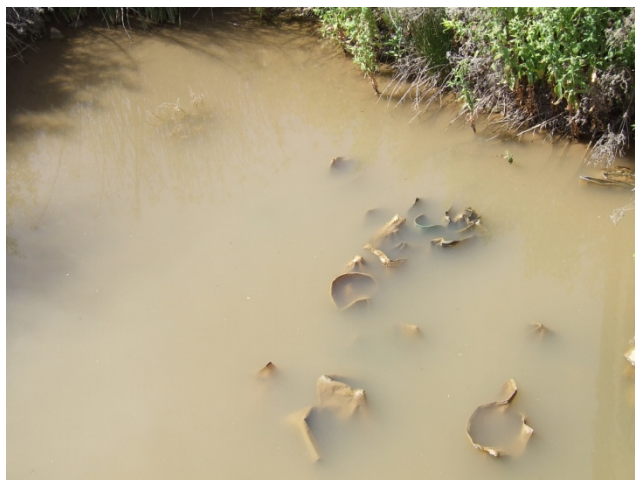
Calidad de las aguas en un Tramo del Río Machel.