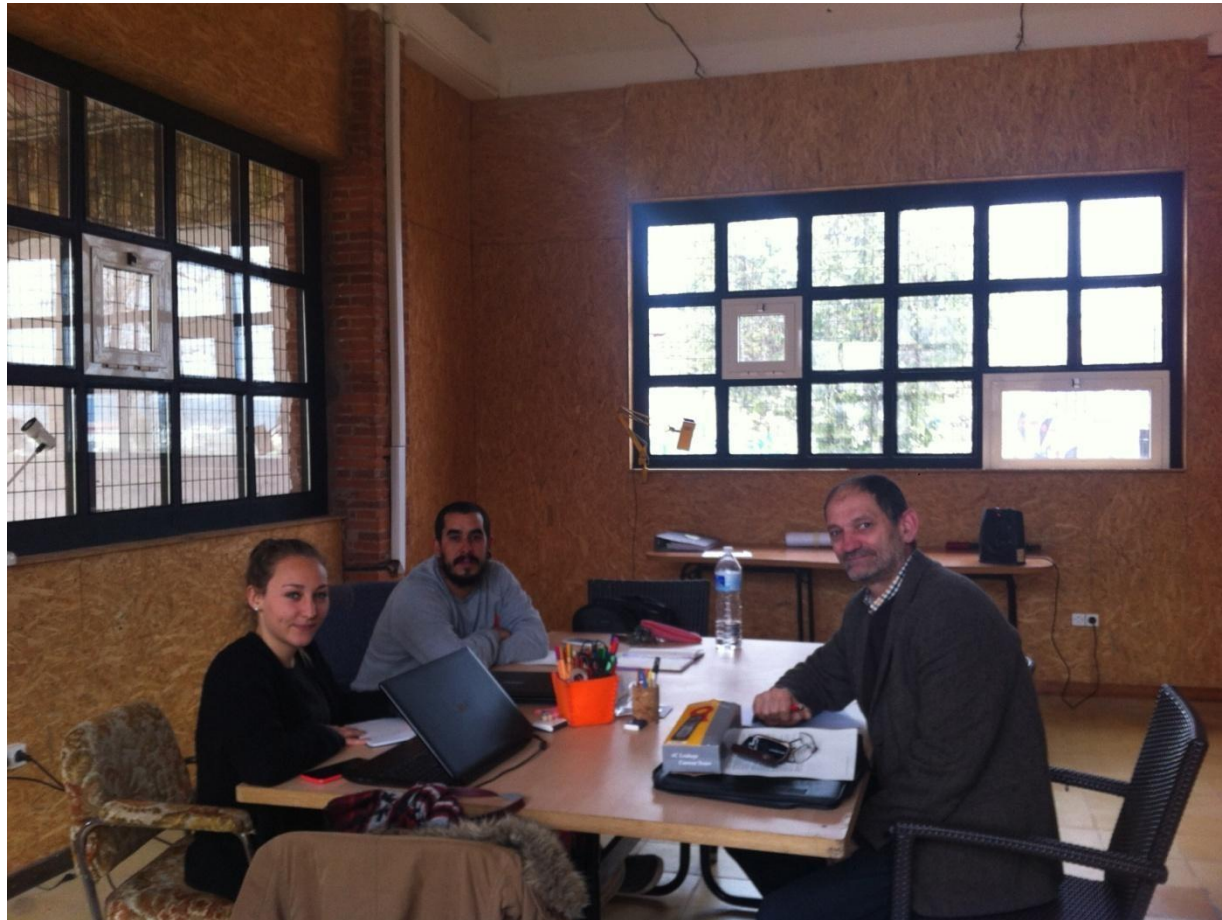
Emprendimiento Social. La fábrica de toda la vida.